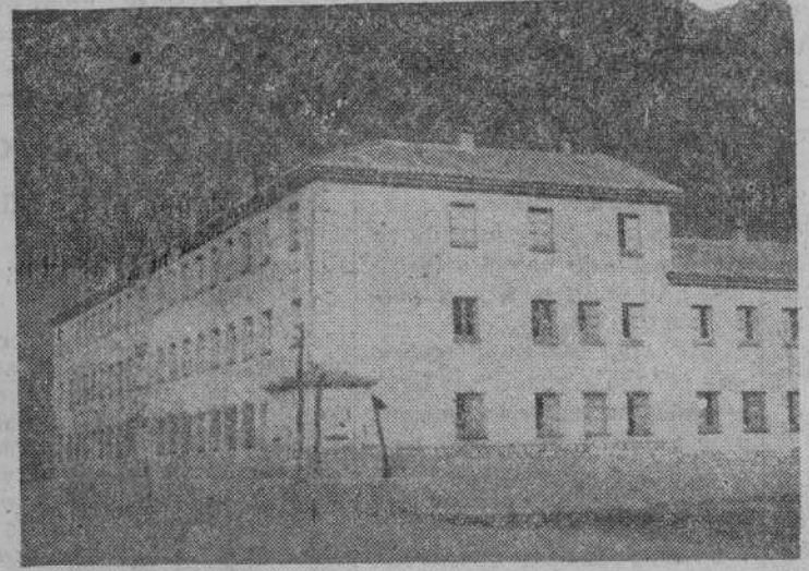
El nuevo cuartel de la Guardia civil en Lumbrales, casi terminado

No es muy conocido el traje y tocado de Lumbrales, y muy pocas veces se ha visto en la capital. Por eso, cuando lo vimos por vez primera, procuramos captar momentos precisos, para conservar esta versión desconocida como una más en la inmensa variedad y riqueza con que el traje salmantino responde también a sus variantes geográficas y climatológicas, de producción y de paisaje, de monumentos y de historia, que nunca sabremos apreciar bastante.