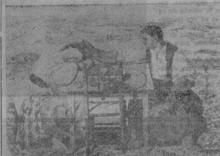
«Amantes», obra de Zacarías González

El «Paisaje» tiene un poder atractivo visto desde lejos. Pero el encanto se rompe un