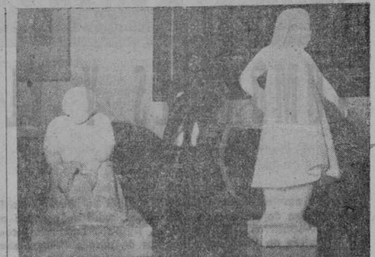
Tres de las esculturas presentadas en la exposición

La pintura de Zaca, dentro de esa corriente modernista que hoy practican numerosos pintores jóvenes españoles, sigue una línea recta de la que no se ha deviado lo más mínimo. Ha entrado de lleno en ese mundo de figuras un tanto deshumanizadas, dibujadas un poco rudamente, y en esa luminosidad característica que le permite iluminar con una claridad abundosa todo lo que le circunda. Su cuadro principal, «Amantes», es el que se ha llevado el primer premio y el que representará a Salamanca en la Bienal, junto con el de Abraido.