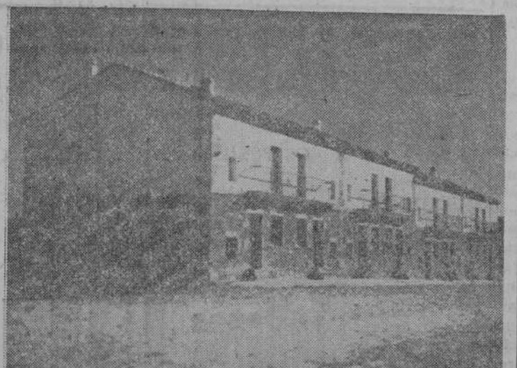
Grupo de casas para maestros construido en Lumbrales

En esa ruta de Salamanca a la frontera portuguesa por La Fregeneda, con las obras del Salto de Saucelle en marcha y su no lejana terminación, Lumbrales, actual importante centro de la región, ha de ser parada indispensable, ya que no le faltan motivos para serlo.