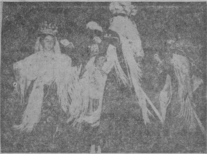
El grupo de Lumbrales en una de sus típicas danzas

Porque a su progreso urbano, une la importancia de sus mercados y su riqueza en tipismo. Nunca olvidaremos la intensa impresión que nos produjo ver por vez primera el traje típico de Lumbrales, en uno de sus grupos de danzas. A la rica variedad de trajes regionales que nuestra provincia tiene, Lumbrales añade una destacadísima propiedad.