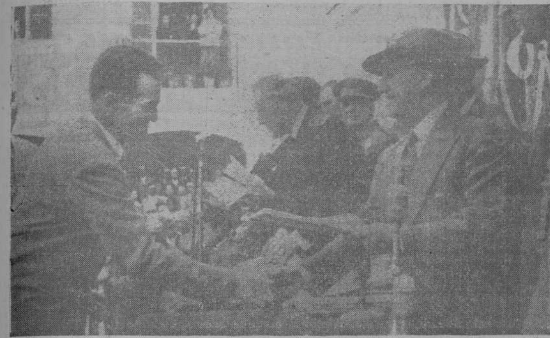
S. E. el Jefe del Estado, entregando los títulos correspondientes a los colonos de la Barca de la Florida