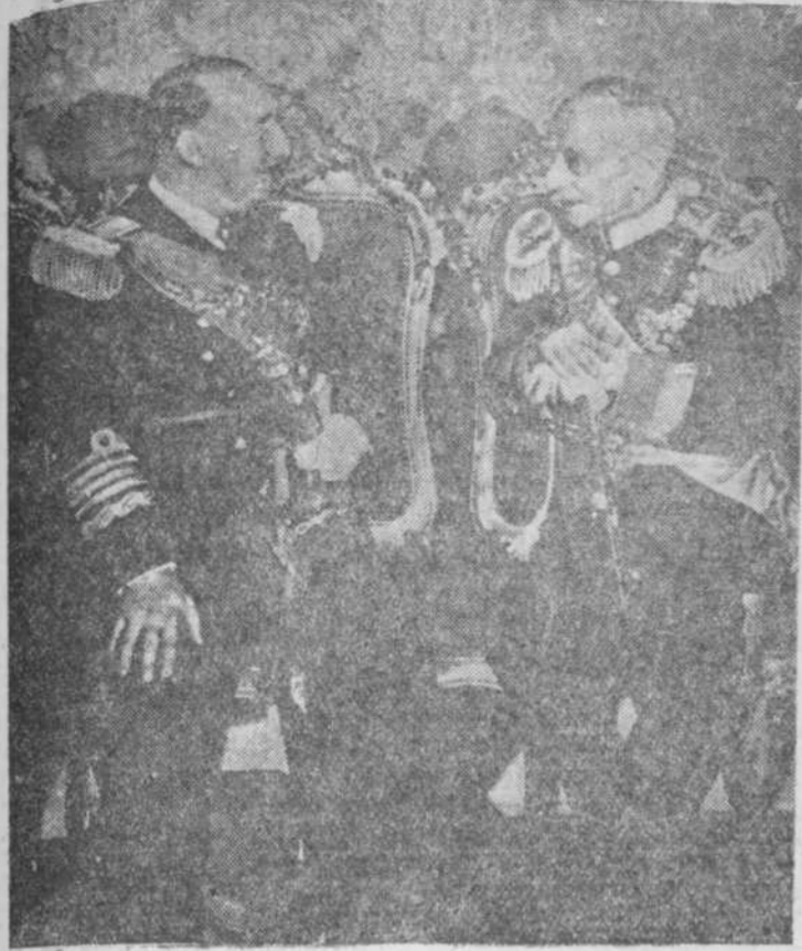
El Caudillo Franco durante la visita que hizo al mariscal Carmona en el Palacio de Belem, pocos momentos después de su llegada a Lisboa

Orense.—El agricultor Pierre Picard, vecino de Saint Sager, fué herido en julio de 1915 por un proyectil que le interesó el ojo izquierdo, perdiéndolo totalmente. Sin embargo, la bala no le pudo ser extraída. La pasada noche Picard notó un violento dolor en la nariz, y al sonarse sintió que algo caía en su garganta. Entonces cesó y comprobó que acababa de expulsar dicho proyectil. (Efe.)