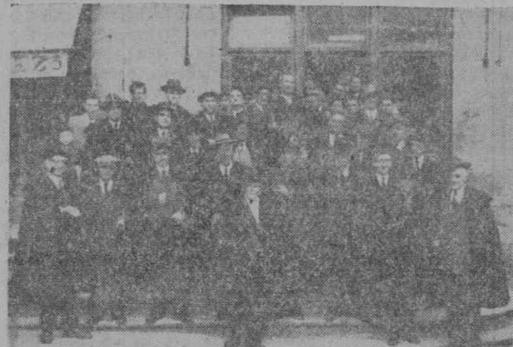
Los «capistas» al salir de la comida de confraternidad