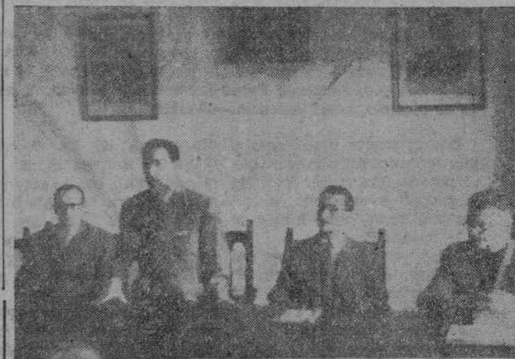
Presidencia del acto de clausura del cursillo de enlaces sindicales

Presidió el acto el delegado provincial, señor Antón