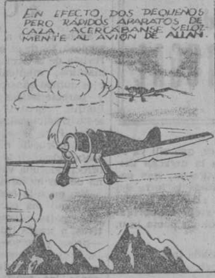
EN EFECTO DOS DEQUENDOS PERO KANDOS AMARATOS DE CALZA ACERCA BANSI NUESTRO AL AVION DE ALIAN.