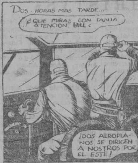
DOS HORAS MAS TARDE... ¿QUE MIRAS CON TANJA ATENCION, BILL?

Madrid. — Resultado provisional del escrutinio de las Apuestas Mutuas Deportivas Benéficas correspondiente a la 25 jornada de Liga del día 22 de los corrientes: Boletos vendidos, 2.092.850. Recaudación, 6.278.568. 55 por 100 de premios, pesetas 3.453.212,40. Reparto de premios: 1.726.606,20 pesetas, a repartir entre tres boletos máximos acertantes de catorce resultados, provisionalmente a 575.535,40 pesetas cada uno. 1.726.606,20 pesetas, a repartir entre 244 boletos más aproximados, de trece resultados, provisionalmente a pesetas 7.076,25 cada uno. Los afortunados poseedores de los boletos de catorce aciertos son doña Maruja Villanueva, esposa del guardia civil don Juan Armisto Sendin, con domicilio en Glón, calle de Camilo Alonso, 15; tiene una hija de nueve años, que fue la que depositó el boleto en el buzón. Otro acertante es doña Amparo Soriano, casada, con domicilio en la calle de Bovedilla, 15, Madrid, y posee un establecimiento de carnes y despojos. Y el tercer boleto, pertenece a don Ignacio Ramo, camarero del Cine Isla Chica, de Huelva. Cada uno de ellos cobrará 575.535,40 pesetas. (Logos.)