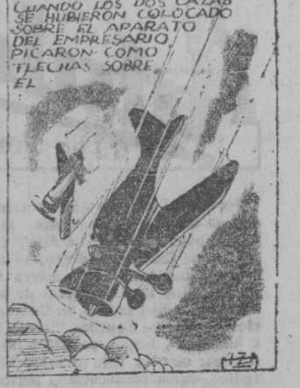
CUANDO LOS DOS CAZAS SE HUBIERON COLOCADO SOBRE EL APARATO DEL EMPRESARIO DICARON COMO TLECHAS SOBRE EL