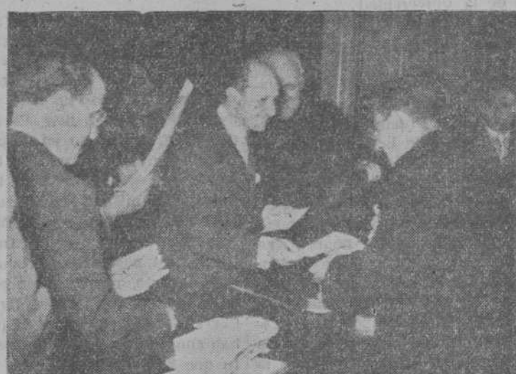
El alcalde de Madrid, conde de Mayalde, hizo entrega a los párrocos de la capital del resultado recaudado para la Campaña de Navidad destinado para los necesitados en los suburbios.