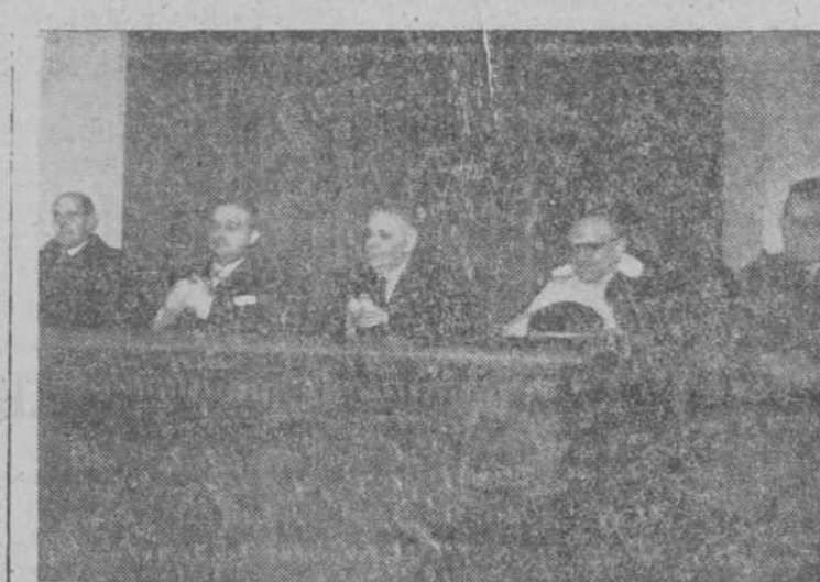
Las autoridades presiden el acto inaugural del curso de Filología hispánica.