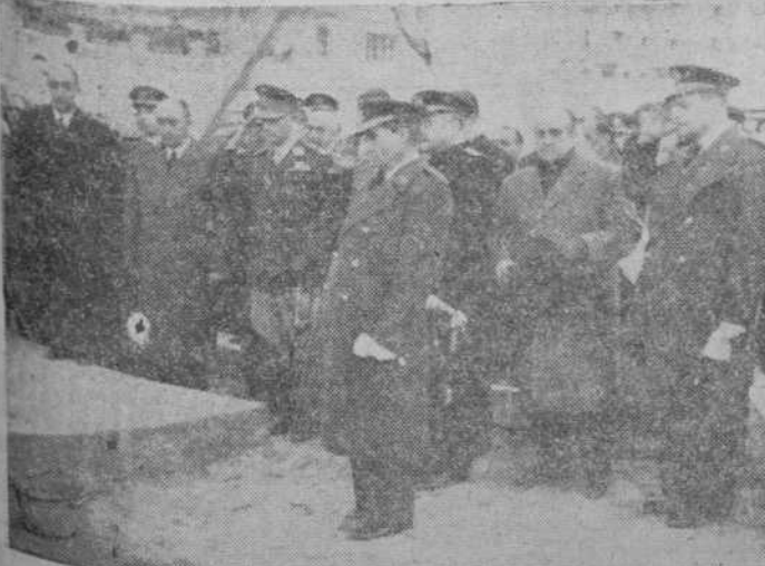
Los ministros del Aire y Gobernación con los embajadores de la Argentina y Brasil, el alcalde de Madrid, el embajador de España en Portugal y otras ilustres personalidades, durante el acto de la colocación de la primera piedra del monumento dedicado a perpetuar la memoria de los héroes del “Plus Ultra”