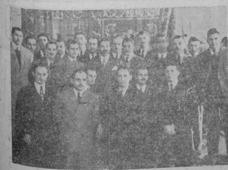
Madrid.—En el salón de actos de la Subsecretaría de la Marina Mercante tuvo lugar el martes la entrega de diplomas a los nuevos capitanes, que aparecen agrupados en la fotografía