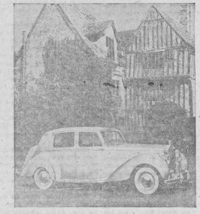
S. A. R. la princesa Isabel recibió hace poco tiempo un nuevo coche Rolls-Royce, el primero de una serie llamada Phantom IV. Lleva un motor de 40 HP.