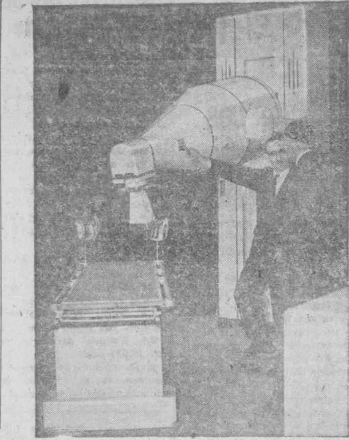
Aparato para el tratamiento del cáncer, que se exhibió en la reciente Exposición de Radiología celebrada en Londres, que fué visitada por más de ocho mil médicos que se dedican a esta especialidad