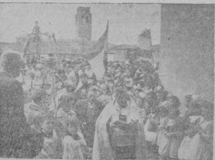
Momento de la bendición de la nueva escuela de Zorita de la Frontera