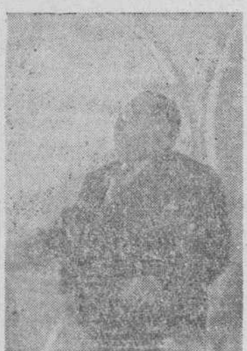
El director general de Enseñanza Universitaria, hablando al finalizar la comida de confraternidad

El capitán de la selección de baloncesto de Prensa recibió la