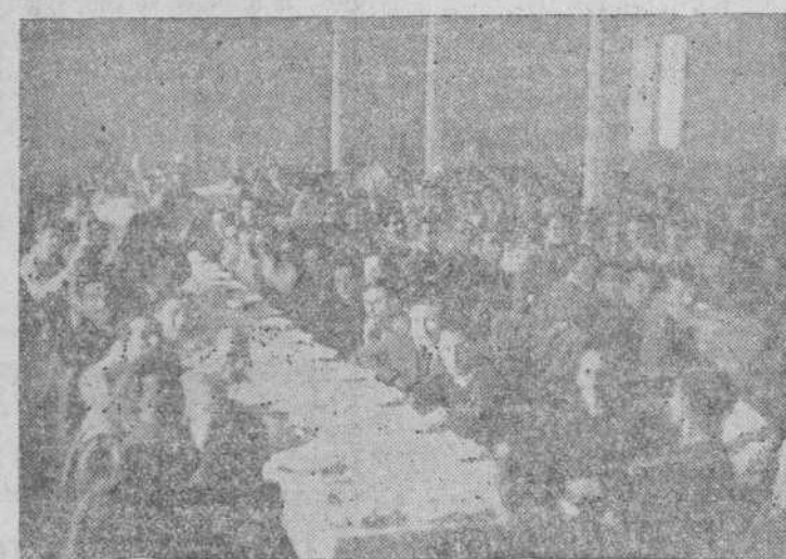
Un aspecto del comedor durante la comida