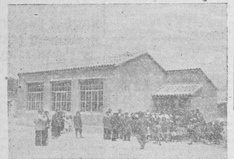
La nueva escuela inaugurada en Zorita de la Frontera