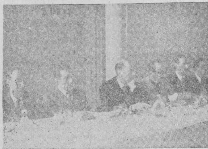
Presidencia de la comida de confraternidad celebrada el domingo