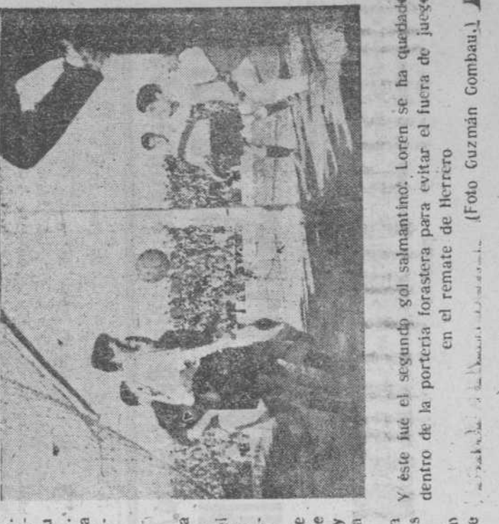
Y este fué el segundo gol salmantino. Loren se ha quedado dentro de la portería forastera para evitar el buca de juego. En el remate de Herrero

empalma un tiro a media altura que se convierte en gol. (Continúa en las páginas centrales.)