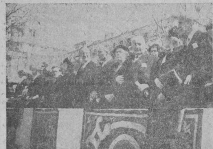
La tribuna del Cuerpo Diplomático, en la que figuran los embajadores de Estados Unidos, Inglaterra, Francia, Colombia, Venezuela, El Salvador, ministro de Suliza, etc., durante el desfile militar del domingo.

decision anterior, el Senado ha resuelto por votación pedir que no se prometan nuevas tropas norteamericanas para el Ejército del Pacto del Atlántico, sin la previa aprobación del Congreso. (Efe.)