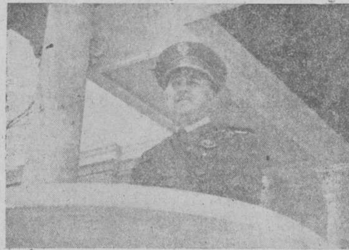
Su Excelencia el Jefe del Estado, Generalísimo Franco, presenciando el desfile desde la tribuna presidencial.

La tribuna que ocupaba la esposa de Su Excelencia el Jefe del Estado llegaron poco después sus hijos los marqueses de Villaverde, cuya presencia fue acogida con muestras de simpatía.