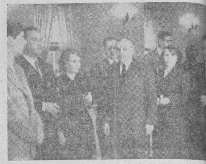
El rector de la Universidad, con los del Colegio Mayor San Cortés, Santa María y presidente del Círculo Portorriqueño, durante el acto de ayer.

CON UN ACTO DE CONFRATERNIDAD HISPANO AMERICANO