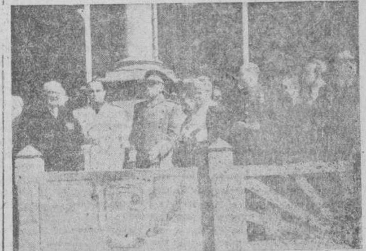
Las primeras autoridades provinciales, presenciando el desfile conmemorativo del XII aniversario de la Victoria.

A las once de la mañana tuvo lugar en la Plaza Mayor una misa de campaña que fue presenciada por las primeras autoridades, numeroso público y las fuerzas de la guarnición.