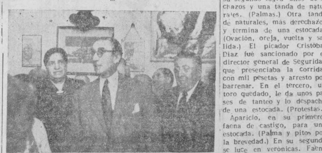
El alcalde de Salamanca, en la inauguración del Museo Taurino