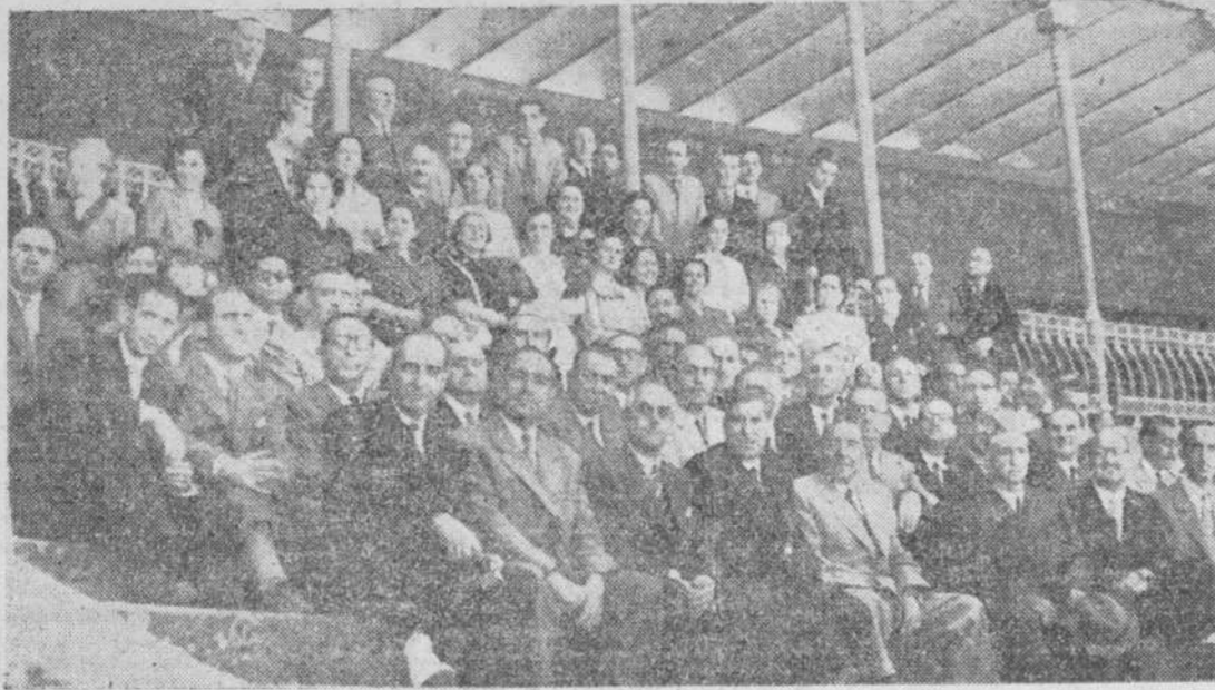
Grupo de asistentes a los actos organizados por el Condominio

Misa por los condeños fallecidos y bendición de la enfermería