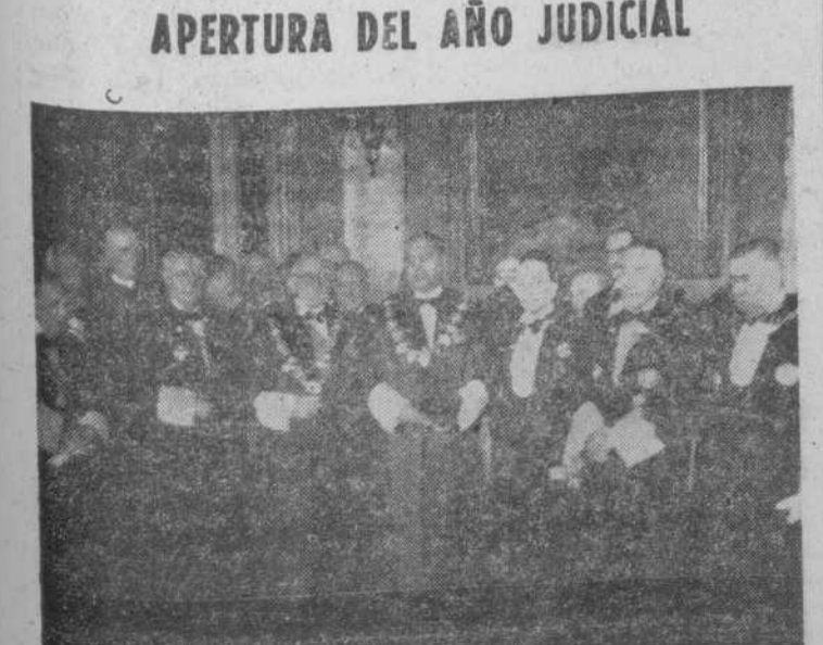
El ministro de Justicia, señor Iturmendi, con el presidente del Tribunal Supremo, señor Castán Tobeñas, y magistrados asistentes al solemne acto de la apertura del Año Judicial