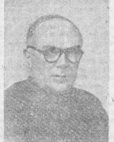
S. A. I. el Jilifa que envió a Tángier una comisión propia para recibirle.