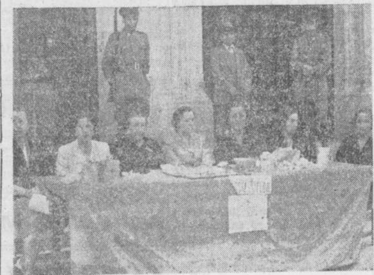
La mesa ante el Banco de España, donde se encontraban distinguidas damas salmantinas

De nuevo la Fiesta de la Flor volvió a sembrar las sopladas de los salmantinos en día tan señalado como el primero de nuestra feria grande. Desde muy temprano numerosas señoritas recorrieron las calles, repartiendo flores de papel entre los transeúntes a cambio de su generosidad para con el Patronato Nacional Antituberculoso, que ha de llevar su ayuda a tantos y tantos necesitados.