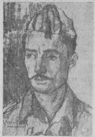
(Dibujo de Mayoral.)

En el campamento de Monte la Reina debe haber mucho sol y mucho aire, porque todos los estudiantes han venido, después de la jura de bande a, morenos y curtidors. Y para que nos lo diga ciertamente, he hablado con el sargento "Rompecántaros", un futuro médico, que hoy, juntamente con sus compañeros, emprenderá el regreso a Monte la Reina para terminar sus deberes militares.