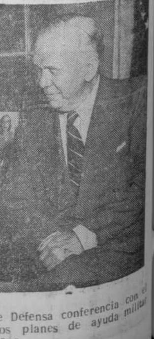
El secretario norteamericano de Defensa conferencia con el presidente Truman acerca de los planes de ayuda militar a Europa