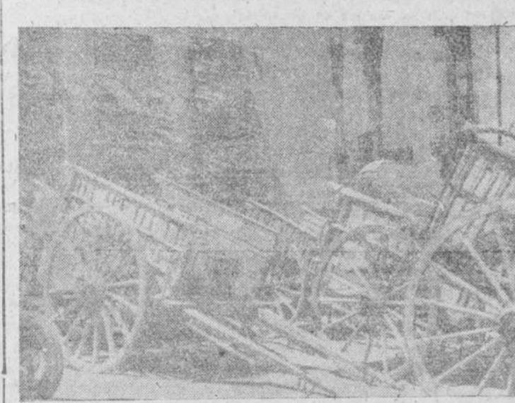
El parador de San Juan, en la Plaza de la Reina, recuerda al de la Cadena, del mismo barrio.