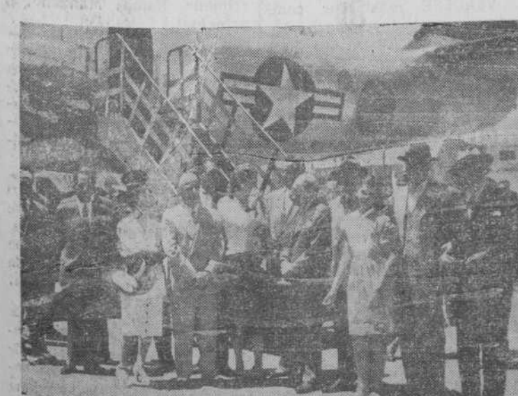
Desde el jueves se encuentran en Madrid, procedentes de Londres, los senadores norteamericanos que integran el grupo perteneciente al Comité de Relaciones Exteriores, que fueron recibidos en el aeropuerto de Barajas por el embajador de su país, Mr. Griffith y otras personalidades.