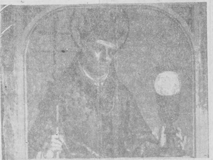
Una de las figuras de la predela del retablo de Santa Catalina, representando a San Gregorio

Los señores Pérez Tormo y Prieto, en su haber profesional y artístico cuentan, entre otras importantísimas, las restauraciones del artesonado mudéjar de la Catedral de Teruel, en una longitud de 37 por 11 metros, teniendo en cuenta que