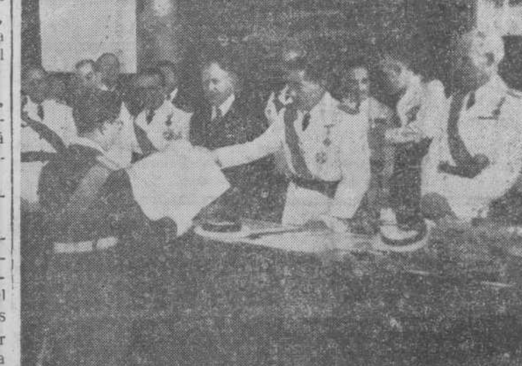
En la Academia Militar de Ingenieros Aeronáuticos de Cuatro Vientos, ha tenido lugar el acto de entrega de premios a la XVII promoción de ingenieros y la IX de ayudantes, acto que ha sido presidido por el ministro del Aire, que hizo entrega de los diplomas correspondientes.