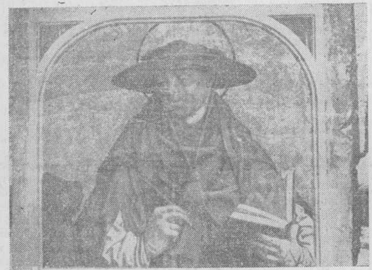
San Jerónimo, que remata el mismo retablo de Gallegos

Por el retablo de los Gallegos, sin más complicación, en la duda, es denominado por unos; por otros atribuido a Fernando Gallegos, y no faltan opiniones autorizadas que aseguran fe hecho por un Francisco Gallegos, estimando que el salmantino pudo tener hermanos, o crear una escuela. Esta obra representa en el centro a Santa Catalina, sentada en la cátedra y a ambos lados dos escenas de su vida, mientras en la predela figuran los Apóstoles San Pedro y San Pablo, San Jerónimo y San Gregorio.