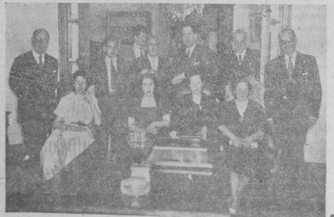
Los representantes de la Sociedad Amigos de Portugal, en el Gobierno civil. En el centro, de izquierda a derecha, los excelentísimos señores Cónsul general de España y Gobernador civil

El periódico entra donde no llega el sermón. Por eso la Iglesia tiene sus periódicos y revistas. Ayúdalos en el «DÍA DE LA PRENSA CATOLICA».