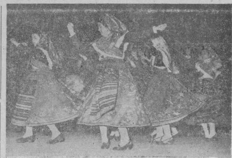
El ritmo solemne del baile charro, interpretado por el grupo de Palencia de Negrilla.

El espectáculo, de manifestación exacta del sentido de nuestro folklore, rivalizó en la espléndida belleza de las figuras de los grupos de Palencia y Aldeadávila, en bailes netamente charras y, sin embargo, con variaciones notables en el brincado de los fandangos y