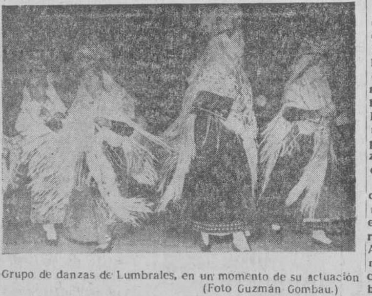
Grupo de danzas de Lumbrales, en un momento de su actuación.

El espectáculo, de manifestación exacta del sentido de nuestro folklore, rivalizó en la espléndida belleza de las figuras de los grupos de Palencia y Aldeadávila, en bailes netamente charras y, sin embargo, con variaciones notables en el brincado de los fandangos y