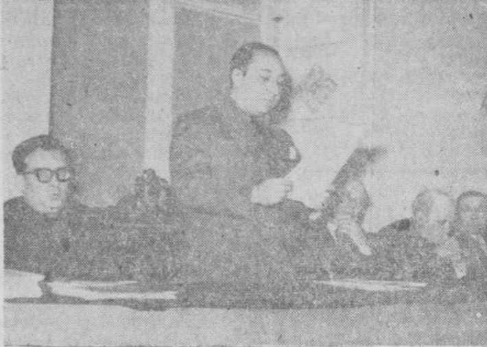
El Gobernador civil y jefe provincial durante su discurso

DATOS DE LA MEMORIA DE LA UNIÓN TERRITORIAL DE