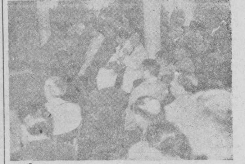
Un aspecto del salón de la Jefatura provincial durante la celebración de la asamblea

La Diócesis de Salamanca se considera deudora a la Santísima Virgen de Peña de Francia, por sus maternales favores, especialmente durante su visita a los pueblos y se apresta ahora a mostrar su agradecimiento.