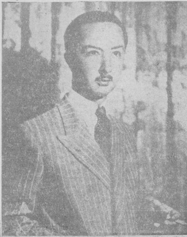
El príncipe regente del Iraq, Abdul Illah, acompañado por el Jefe del Estado y el Gobierno, presenció un gran desfile militar en la Castellana.

Al aparecer el coche que conducía a S. A. R. y a Su Excelencia, el público allí congregado prorrumpió en grandes aplausos, mientras las Bandas de música interpretaban primero el himno iraquita y después el español y las baterías disparaban las salvas de ordenanza.