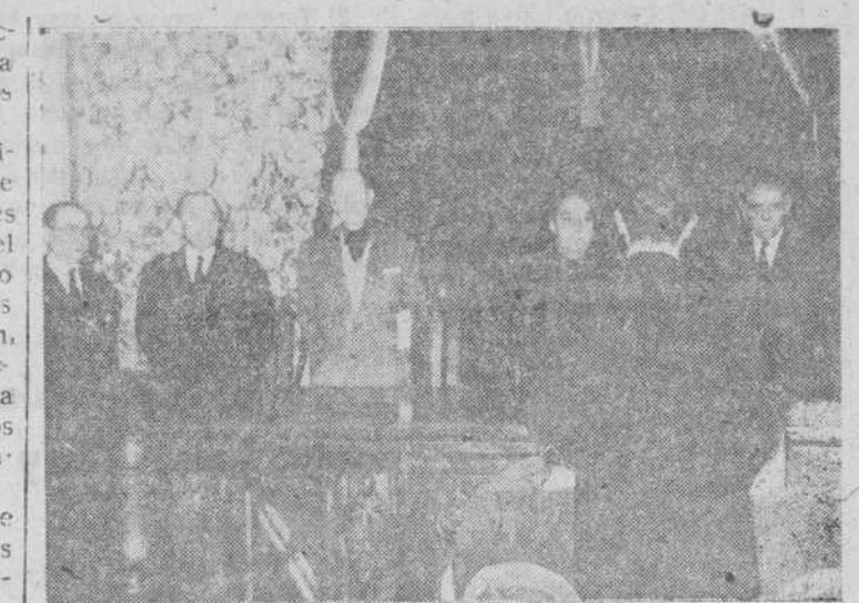
Un momento de la jura de los nuevos diputados provinciales.