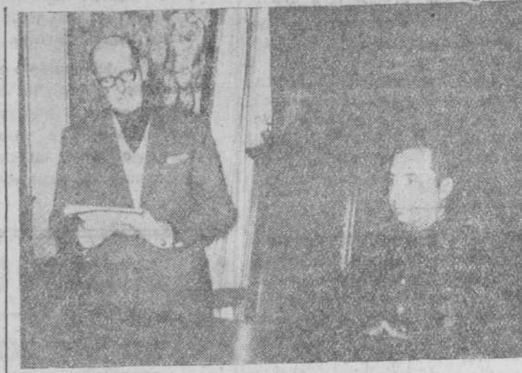
El presidente de la Diputación leyendo su discurso.

Su bien ganada fama de hombres capaces, laboriosos y honorables y su acendrado salmantinismo y falangismo, es presagio de una lucida actuación suya en defensa de los intereses morales y materiales de nuestra provincia y de que sabrán mantener con su proceder la misma armonía, comprensión y camaradería que hasta el momento ha existido entre los componentes de la Corporación y que tanto ha valido para que el desarrollo de las funciones de ésta haya sido normal y fructífero. Aun a trueque de abusar un poco de la atención del excelentísimo señor Gobernador y de los señores diputados, no puedo sustraerme a la tentación de exponer en este momento, siquiera sea brevemente, la labor realizada por la Corporación desde el año de 1946 hasta la fecha, dividiendo esa labor en dos etapas: una, que termina en el mes de abril de 1949 en que se constituyó la Diputación que ahora ha sido por mitad renovada; y, otra, a partir de dicho instante para terminar en el día de hoy en que se produce indicada renovación. Ello lo estimo conveniente ya que servirá como índice informativo al señor presidente nato de la Diputación y a los nuevos diputados; como recuerdo de lo hecho para los salientes y para los que quedan; y como oleada que todos podemos echar al campo donde hemos de realizar nuestros futuros trabajos y sembrar nuestras iniciativas.