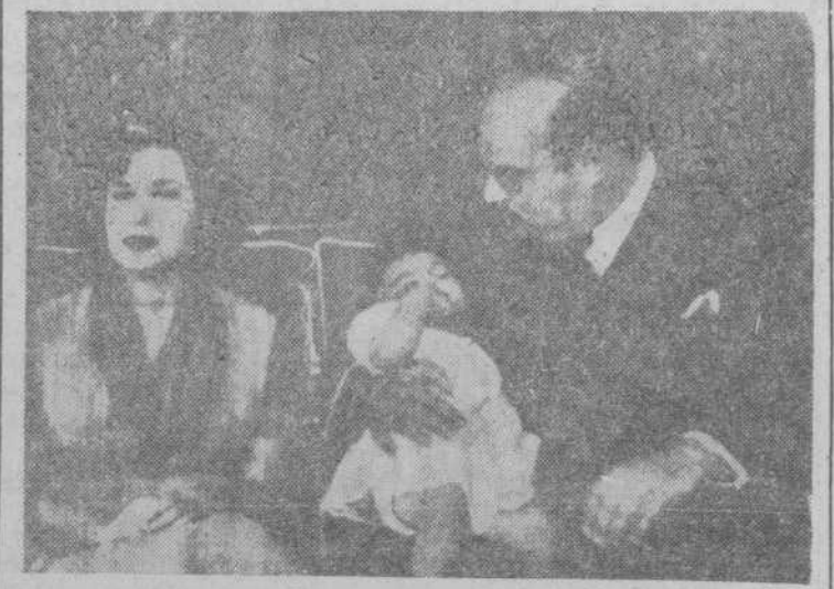
He aquí la última fotografía obtenida de la Familia Real egipcia a su llegada a Capri, en Italia, después de la entrevista concedida a los representantes de la Prensa.