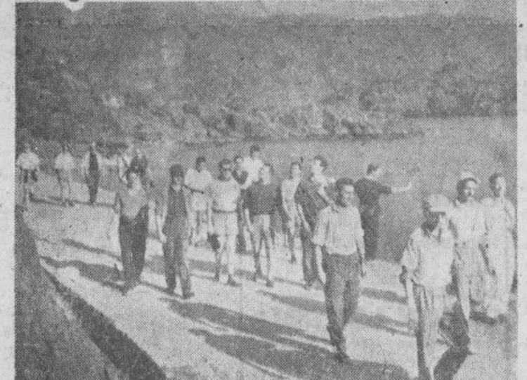
Un grupo de "Los Gavilanes", al regreso de la excursión al Molcalvo, que se ve al fondo.

La Coruña.—Primera de feria. Seis toros de Benitez Cubero, para Aparicio, Litri y Posada. Aparicio hacia su presentación. Casi lleno.