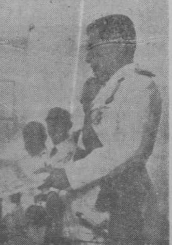
El ministro del Aire, general Gallarza, en el acto de hacer entrega del título a uno de los nuevos ingenieros

Washington. — El aspirante a candidato presidencial demócrata, Averell Harriman, acusa a los republicanos de haber adoptado una política exterior poco honrada y una política laboral insultante. Dice que John Foster Dulles, ex funcionario del Departamento de Estado y autor de la parte de política exterior del programa aprobado por la Convención republicana de Chicago no ha hecho sino reunir en un documento los puntos de vista de Hoover, Tatt, Eisenhower y Mac Arthur. Promete ayuda a las fuerzas de seguridad colectiva en Europa y otros lugares, pero de