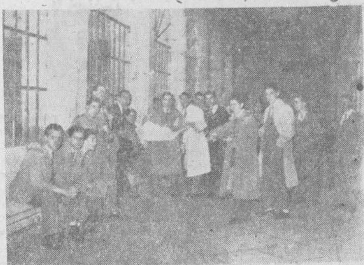
Entre clase y clase, en los claustros los escolares descansan, charlan, bromean y leen EL ADELANTO

de estudiantes ha alcanzado un número que nunca soñaran los Claustros de Profesores de pasadas generaciones, y es, que, indudablemente, existe un estímulo, un afán de superación que, sin reparar sacrificios, muchas veces limitando las economías domésticas, va en derredura de metas espirituales, logradas con la satisfacción de ver a un hijo me-