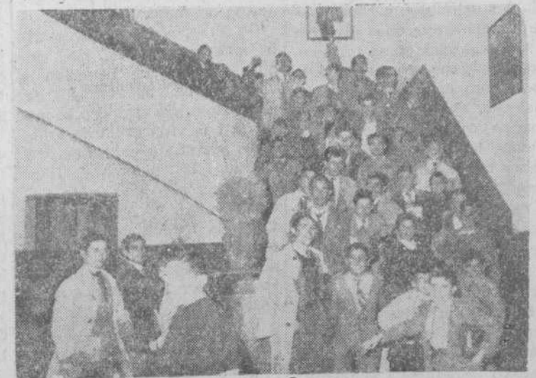
No están colocados para retratarse. Así en grupo bajan por centenares los futuros bachilleres, cada día al fin de las clases

Y he aquí a un muchachote de diecisiete años, con su título de Bachiller, dispuesto a dar comienzo a la carrera universitaria. Hasta aquí, todo fue relativamente fácil; las mayores preocupaciones quedaban a cargo de los directores de los colegios y residencias, y el estudiante sólo pensó en sus asignaturas y sus