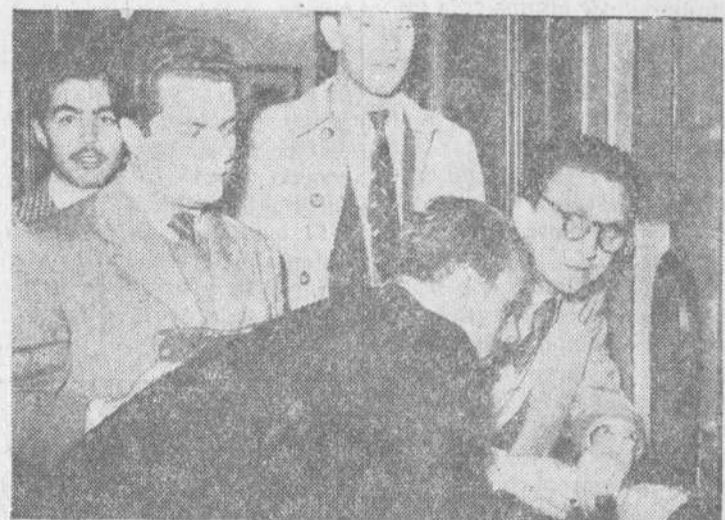
Un grupo de estudiantes de Derecho "retratándose" por partida doble ante la ventanilla de secretaria

Esta es la realidad. Hoy día el poseer un título universitario equivale a estar en posesión de una buena fortuna.