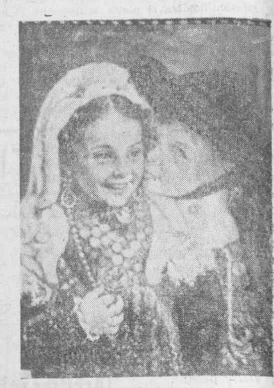
"Charrillos", óleo de Sánchez-León

Si alguna duda podía quedarnos sobre la aforosidad y entusiasmo que registra con el mayor agrado.