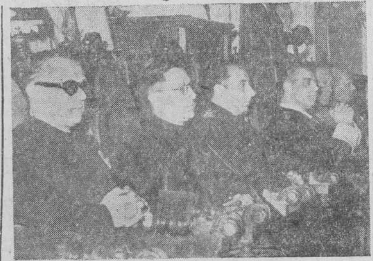
Presidencia de la apertura de Curso Académico en la Universidad Literaria