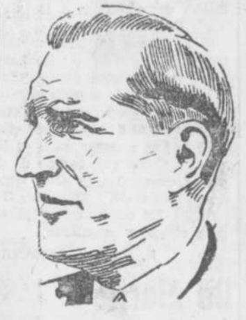
que haga entrar en funcionamiento el Pacto. —Puede V. E. darnos a conocer si cree que el Pacto de amistad entre España y Portugal está en armonía completa con el espíritu y las condiciones del Pacto, y si Portugal, en vista de ello, tratará eventualmente de que España sea admitida en este instrumento de paz? —El Pacto de amistad y no agresión y el protocolo adicional entre Portugal y España son compatibles en principio con el Pacto del Atlántico. Así lo consideráramos y lo declaramos conjuntamente. Los compromisos que eventualmente se deriven del Pacto o asumidos en virtud de él, deben de ser reconciliados con los principios de los acuerdos con España y con las razones señaladas. —Opina V. E. que es indispensable que la Península Ibérica, en su totalidad, forme parte del Pacto del Atlántico para que funcione en forma eficaz un frente occidental contra la posibilidad de una agresión? —En estas circunstancias, Portugal es partidario de que se procure la inclusión de España en el Pacto del Atlántico, y si por cualquier circunstancia las dificultades políticas continúan entorpeciendo el camino de su adhesión formal, debe buscarse alguna otra inteligencia entre España y las demás naciones. El pleno funcionamiento de un frente occidental contra las posibilidades de una agresión está condicionada por una política idéntica sentida para toda la Península Ibérica. (Efe.)

compartibles en principio con el Pacto del Atlántico. Así lo consideráramos y lo declaramos conjuntamente. Los compromisos que eventualmente se deriven del Pacto o asumidos en virtud de él, deben de ser reconciliados con los principios de los acuerdos con España y con las razones señaladas. —Opina V. E. que es indispensable que la Península Ibérica, en su totalidad, forme parte del Pacto del Atlántico para que funcione en forma eficaz un frente occidental contra la posibilidad de una agresión? —En estas circunstancias, Portugal es partidario de que se procure la inclusión de España en el Pacto del Atlántico, y si por cualquier circunstancia las dificultades políticas continúan entorpeciendo el camino de su adhesión formal, debe buscarse alguna otra inteligencia entre España y las demás naciones. El pleno funcionamiento de un frente occidental contra las posibilidades de una agresión está condicionada por una política idéntica sentida para toda la Península Ibérica. (Efe.)