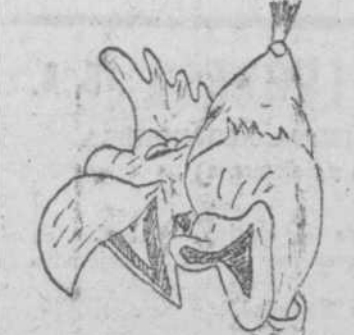
"Dos locos", por Micaela Sánchez