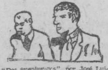
"Dos aventureros", por José Luis Vicente

El Adelanto Es el diario más antiguo de la capital y provincia