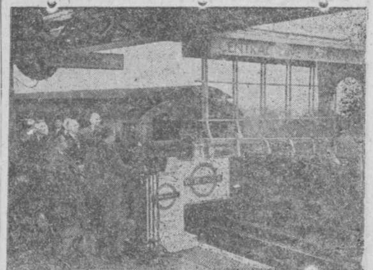
Mr. Barnor, ministro del Transporte, en la inauguración de una nueva línea de 18 kilómetros de longitud