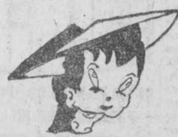
"Abelino", por Juan Agustín Boyero

—No se puede consentir; repita usted el trabajo. Me toma mi lápicero, mi papel y cartabón, y cual su mano guiada por algún ángel del cielo, sale el dibujo ya entero cual está en el pizarrón. Y me explica un poco luego, y... ¡ya sé, ya me salió!... Poco a poco a dibujar nos enseña el profesor. Si algunos se dieran cuenta del bien que el dibujo hace, en vez de hablar y reír, obrarían con un lápiz. Esfudat y dibujad, que recompensa obtendréis, ya que no ocupa lugar la cultura y el saber.