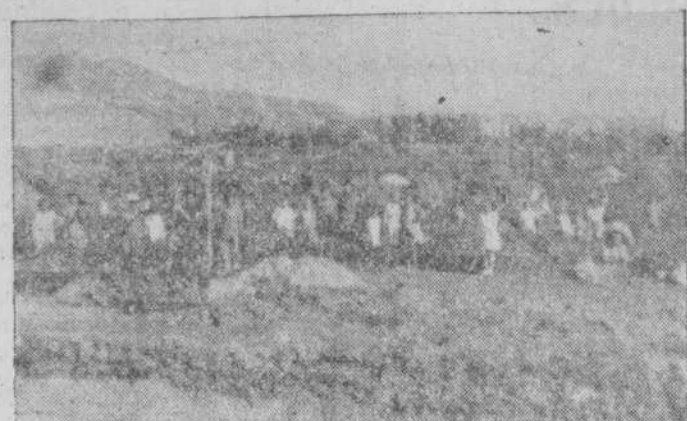
Huertos familiares de Macotera