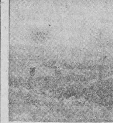
Huertos familiares de Villoria

Alba de Tormes, 156; Alcañada, 25; Aldeanueva, 101; Aldeanueva de Alba, 22; Aldeneza de la Frontera, 17; Amatas de Alba, 3; Barbado, 183; Barco de Salvatierra, 23; Bocoana, 60; Bóveda del Río Almar, 20; Cabrerizos, 91; Cabrillos, 126; Calzada de don Diego, 80; Cantalpino, 78; Mozdel, 3; Ojeda, 56; Cubo de don Sancho, 171; Eximias de Arriba, 25; Fresno Abánziga, 32; Galleguillos, 9; Gajates, 38; La Lardá, 4; Golpejas, 40; Higuera, 23; Macotera, 206; Cercoseda de la Sierra, 118; Malpartida, 41; Miranda de Azán, 56; Huerta, 82; Navales, 11; Pedraza de Alba, 41; Peñorredonda de Alba, 34; Peñarandilla, 94; Peralejos de Abajo, 24; Robliza, 106; Salmoral, 243; Salvatierra de Tormes, 25; San Pedro del Valle, 20; Santiago de la Puebla, 132; Sancti Spiritus, 195; Santiz, 80; Serradilla, 200; Sieteiglesias, 25; Torallos, 39; Torremoutras, 94; Turra, 5; Villafra, 130; Villamayor, 18; Villoria, 242; Vitigudino, 112; Zorita de la Frontera, 55; Bucanavita, 23; Palomares, 9; Encinas de Abajo, 42; Tarazona de Guareña, 28; Arribayona de Mofra, 18; Sanclero Hilario, 78; Valdecarlos, 33; Doninos, 35; Aldeanueva de Figueroa, 23; Espino de la Orbeta, 80; Valdeola, 78; La Vellos, 48.