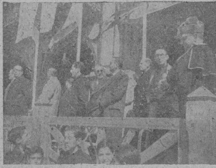
Las primeras autoridades salmantinas presencian el desfile de las fuerzas de la guarnición desde la tribuna levantada en la Plaza Mayor.

Este pueblo salmantino, parco en expresiones, lo es entusiasta sin embargo, cuando con su presencia llena las calles, y la Plaza Mayor, para adherirse en masa a un símbolo, una conmemoración o una solemnidad. Y así, bien podemos afirmar, que ayer, como pocas veces, la fecha de la Victoria española, fué celebrada por los salmantinos con el más acendrado fervor patriótico. Nuestra Plaza Mayor, durante la misa de campaña que tuvo lugar en ella, se vio llena por compactas masas en las aceras y soportales y presenciada el desfile de las tropas de Infantería, Ingenieros, Aviación, Guardia civil y de Fronteras y las centurias del Frente de Juventudes, el público invadió las calzadas como en los días de máxima concurrencia.