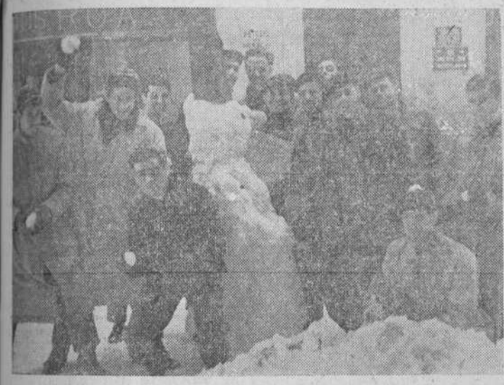
Un grupo de estudiantes salmantinos en medio del mejor humor este muñecón en la Rúa Mayor, en medio del mejor humor

biendo, lo que hacía prever que a las doce de la noche el temporal amainase. LA ULTIMA IMPRESION A última hora de la tarde cedió en intensidad el viento y volvió a caer nieve en copos lentos y gruesos, que cambiaron la fisonomía de la nevada, al cuajar ésta en todos los tejados y torres que antes se habían librado, porque el viento no dejaba posarse la nieve en ellos. Así, por la noche, todo estaba cubierto y aunque a intervalos seguía nevando hasta la madrugada.