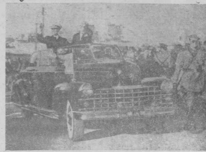
S. E. el jefe del Estado, al desembarcar del crucero "Canarias", después de haber pasado revista a la Escuadra, saluda al pueblo gaditano, que acogió su presencia entre delirantes aclamaciones.