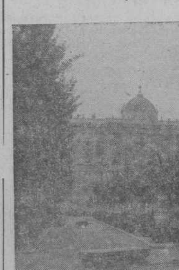
Los nuevos jardines que ocupan el lugar donde estuvo el edificio de Caballerizas, que serán inaugurados hoy, domingo.