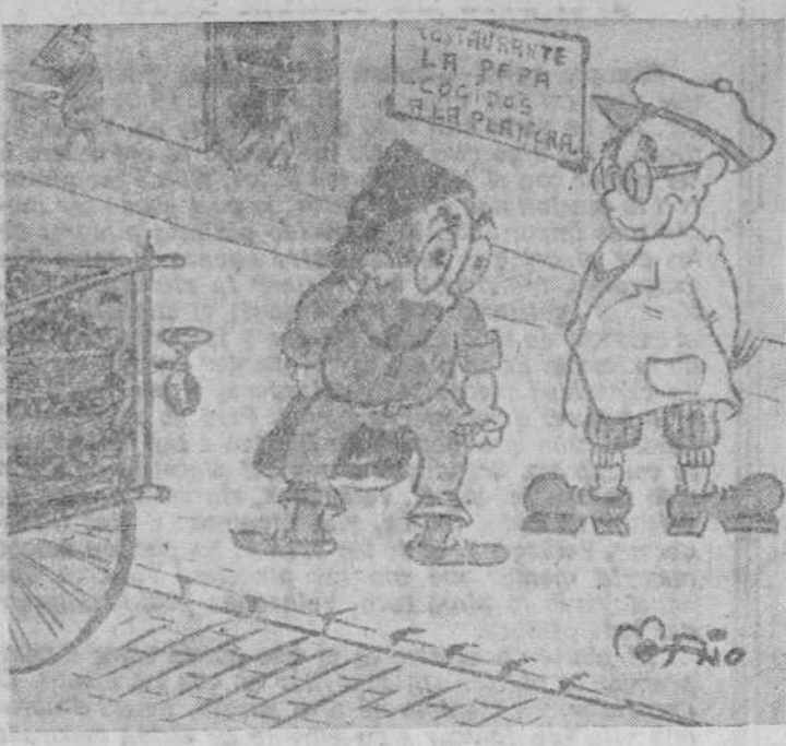
¡Turista miopillo! —¡Ole, las españolas castizas con mantilla...!