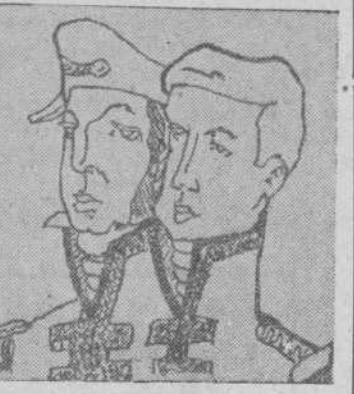
Daioz y Velarde