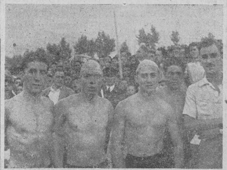
El equipo del Club Fluvial

Animamos al Fluvial para su próxima edición sea ya regional. En Valladolid hay clubs de natación y en Zamora también; la pugna, la rivalidad serán beneficiosas en todos los aspectos, y si este ensayo, como es de esperar, da un buen resultado en 1951, entonces para 1952, y al conmemorar el décimo aniversario de la Travesía, ésta podría tener su mejor solemnidad, en, a semejanza de similares pruebas en el Uruma (San Sebastián), Arga (Pamplona), etc., darle carácter de nacional.