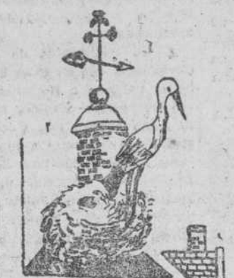
La cigüeña en su nido", por Aurea González Fernández.

Observe este pequeño detalle: NUESTRO HIELO ES SIEMPRE CRISTALINO Y DE AGRADABLE SABOR.