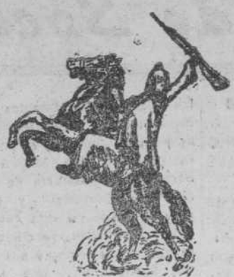
"Corriendo la pólvora", por Carlos Bravo Guerreira.