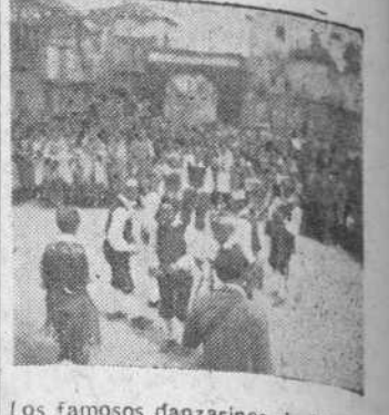
Los famosos danzantes de Miranda que realizaron exhibiciones durante los actos.

Miranda del Castañar es un pueblo de carácter, de fisonomía original y aun de historia. Ser un pueblo de historia significa mucho; pero conservar un carácter significa más. La historia de Miranda no se ha escrito todavía. Dan testimonio de ella los vestigios de un castillo con su alrosa torre; docenas de escudos nobiliarios que pregonan estirpes famosas; la muralla con sus puertas ojivales guardadas por una imagen; las antiquísimas cofrades, las Ordenanzas e interesantes antecedentes conservados en archivos y viejos pergaminos. El carácter se gana cuando, además de haber sabido conservar todo eso, lo que es historia, y se da la sensación de un pueblo arremansado en los siglos, se sigue tirando del pasado como en vivencia permanente. Esas vistosísimas danzas, cuyo origen se pierde en las más remotas lejanías; las fiestas tradicionales, la franca hospitalidad, el humor recto y expansivo, son elementos de aquella fisonomía que ni extinguido ni modifica el tiempo.