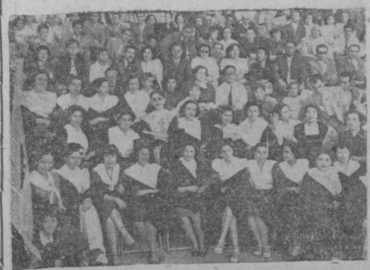
Aspecto parcial del anfiteatro del recinto de la Feria del Campo, con las modistillas que acudieron a presenciar el festival del Día de Madrid.