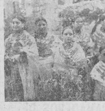
Un grupo de señoras vistiendo el traje típico

En un rincón del bello paisaje serrano se alza Miranda, antiguo señorío de los condes de este nombre; en este lugar, vestido de fiesta y elevado en ansias de superación, se inauguró el pasado día 11 la Biblioteca Municipal Juan Bonifacio, desde la cual, con gesto simpático y amable intentan todas las autoridades conseguir el mejoramiento rural necesario en estos ambientes, como sedante en la lucha por la vida, donde el ejemplo y la ciencia formen el alma de pueblos sanos para una patria grande. Para ello se engalanar las calles y principalmente la de la Avenida de Diego Salas Pombo, cuya lápida dando nombre a la misma se descubriría a continuación de oír la santa misa, destacándose en toda clase de ornamentación y demás detalles, por su esfuerzo máximo, el Magisterio, como afecto sincero al pueblo de Miranda e identificación con la total a los desvelos del dignísimo alcalde y compañero, don Jesús Sánchez, que labora dentro de una competencia probada y completa, por los intereses de esta noble villa, que agradecido con su entusiasmo los esfuerzos del mismo y la visita de todas las justas personalidades. A continuación del recibimiento, coros, danzas, santa misa, descubrimiento de la citada lápida, saludo del excelentísimo señor gobernador al pueblo con palabras justas, amables y corteses, que fueron muy aplaudidas; otras del señor Bordonau, complacido de asistir a la inauguración y