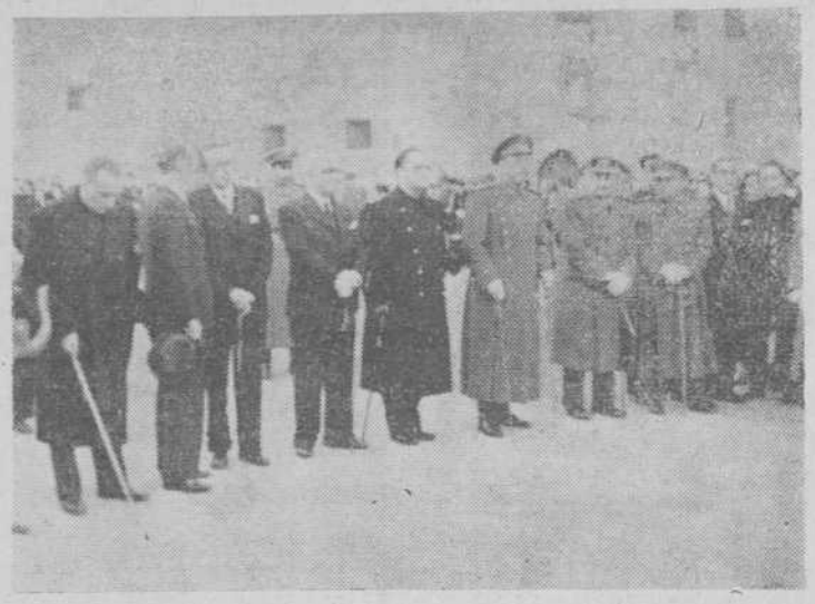
Presidencia de la procesión general del Santo Entierro

A las cinco de la madrugada, salió de San Esteban, la Her-