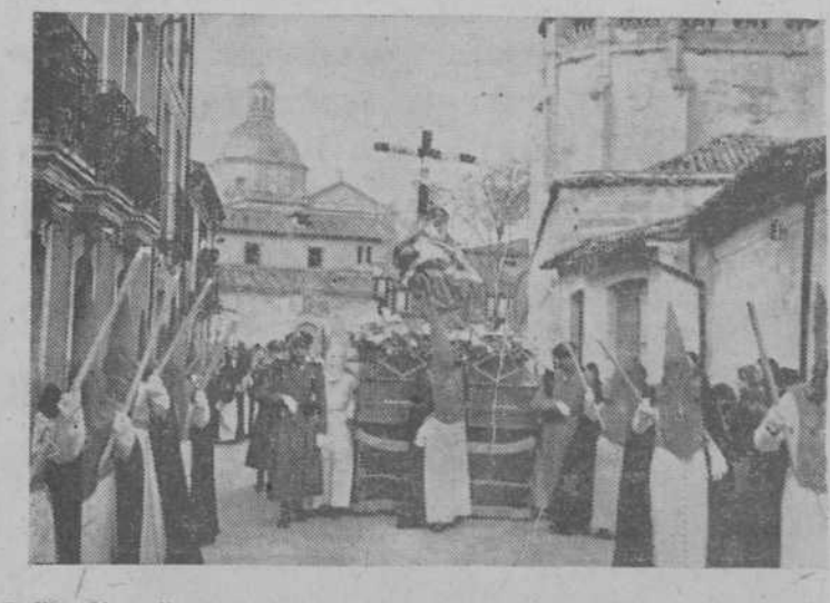
"La Piedad", de Carmona, en el desfile procesional de la Cofradía Dominicana

En sufragio de su alma se celebrarán misas en los pueblos de Valdelacasa, San Miguel de Valero y Escorial de la Sierra, el día 10, y, en esta misma fecha, en la iglesia de San Juan de Sahagún, de Salamanca, a las nueve, nueve y media y diez. La misa de aniversario tendrá lugar el día 19 en la iglesia de Valdelacasa, celebrándose ese mismo día en la iglesia del Buen Suceso, de Madrid, misas a las nueve y media y diez de la mañana.