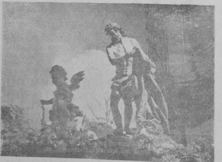
La imagen de Jesús Flagelado, en la nueva carroza, y que ayer hizo su entrada en la procesión general del Santo Entierro.