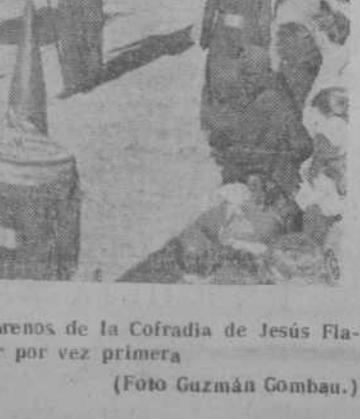
Un momento del desfile de los nazarenos de la Cofradía de Jesús Flageado, que salió ayer por vez primera

La procesión, recorriendo el itinerario de costumbre, en el que se esacionó numerosísimo público, especialmente en la Plaza Mayor, que presentaba un aspecto fantástico, dada la multitud en ella congregada, hizo Estación en la Catedral y en la Universidad, a cuya capilla pasó unos momentos el Santo Sepulcro.