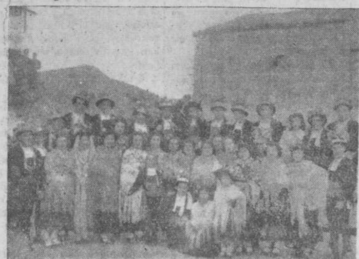
Grupo de charros y charras que concurrieron al barrio de la Fuente, en Lumbrales