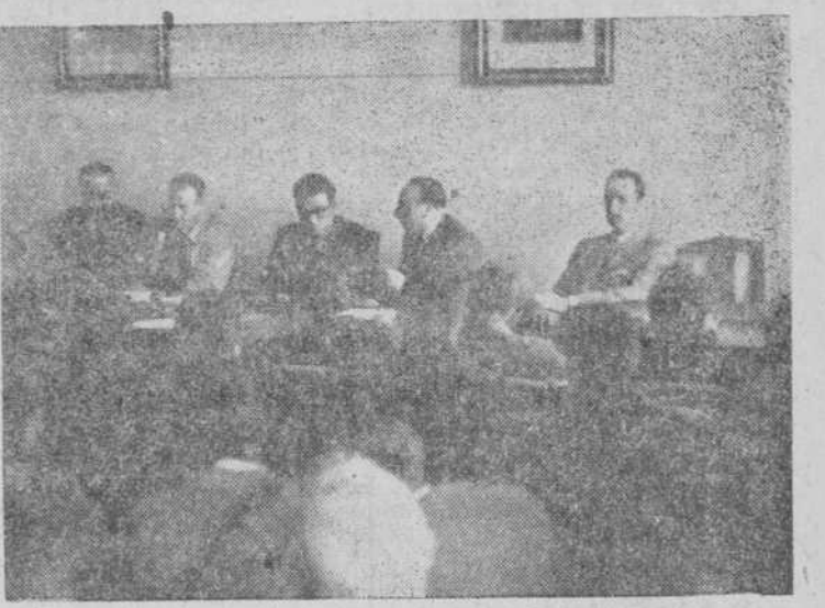
Presidencia de los actos sindicales celebrados ayer en Béjar

En esta reunión, como en las particulares de las secciones sociales, se estudiaron en animado diálogo, que refleja una vez más la confianza depositada por el campo en la organización sindical, los métodos y trámites a seguir en la labor coordinada que se pretende realizar, y finalmente el delegado sindical dio cuenta de un avance de la aplicación del plan asistencial a esta comarca, con las importantes concesiones ya previstas en el presupuesto y memoria de la 8ª.