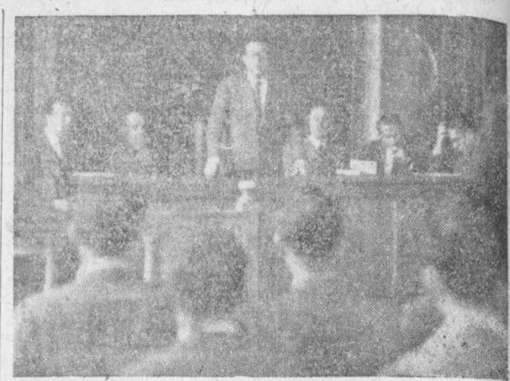
Acto de clausura del cursillo, celebrado ayer

Durante estos días se ha venido celebrando el cursillo sobre "Semillas y Fertilizantes", organizado por la Cámara Oficial Sindical Agraria de Salamanca y la Junta Nacional de Hermandades, con la colaboración de los servicios técnicos del Ministerio de Agricultura, siguiendo así la labor de divulgación agrícola, que se viene realizando por estas entidades.