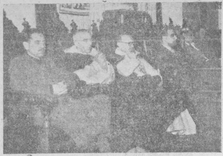
Presidencia del acto en el Paraninfo