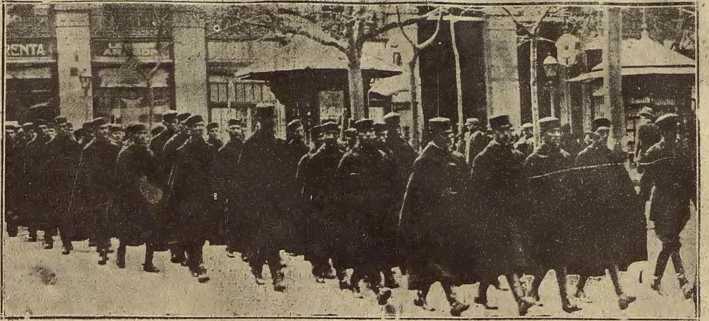
REPATRIACION DE TROPAS.—LOS ARTILLEROS DEL 9.º LIGERO, QUE LLEGARON ANTEAYER A ZARAGOZA, AL ENTRAR EN EL TEMPLO DEL PILAR EN LA MAÑANA DE AYER.