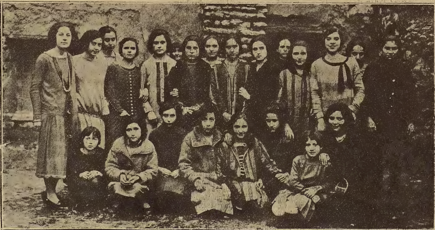
LANAJA.—Este pueblo, donde se ha visto agotarse todas las plantas a causa de la sequía puede presentar la floración espléndida de bellísimas mujeres. He aquí un grupo de hermosas señoritas de Lanaja.

Cuarta. El jurado será elegido por votación, entre los señores asociados, en la última sesión científica del mes de marzo próximo. Quinta. Los premios se otorgarán en el día que se celebre la última sesión científica del presente curso, en la ciudad de Huesca.