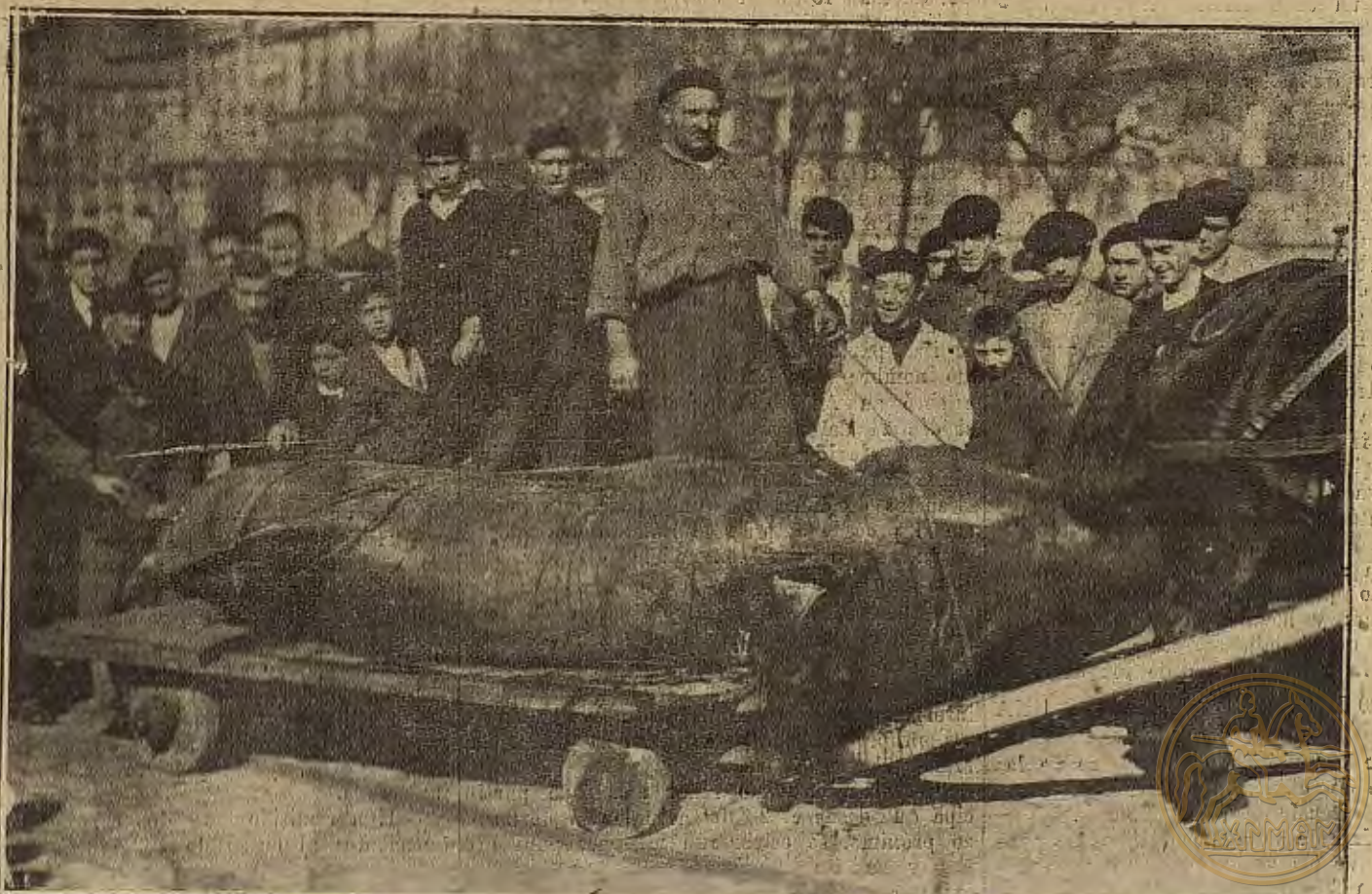
SAN SEBASTIAN.—El colayo de siete metros de largo y 1.200 kilos de peso, pescado en esta costa recientemente y remitido a Zaragoza

Bocadillos, Helados, Licores, Chocolatas, Repostería, Mariscos