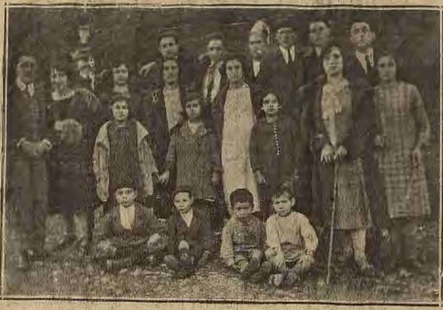
DE AGUERO.—Grupo de señoritas y muchachos que contribuyeron a dar animación a las fiestas recientemente celebradas

Les alcanzó ya la noticia de que «Azorín» pretende lanzarse a la azarosa lucha de los escenarios, navegando a toda vela por el pelágico sembrado de escollos de la vida farandulesca?