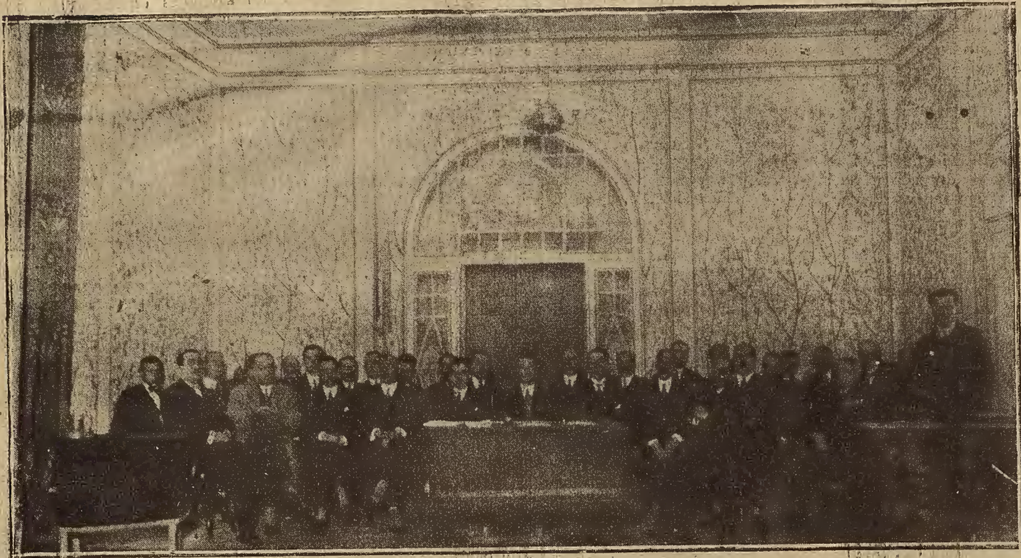
BARCELONA.—Mesa presidencial de la Asamblea de Viticultores de España, celebrada en el teatro Poliorama el domingo último.