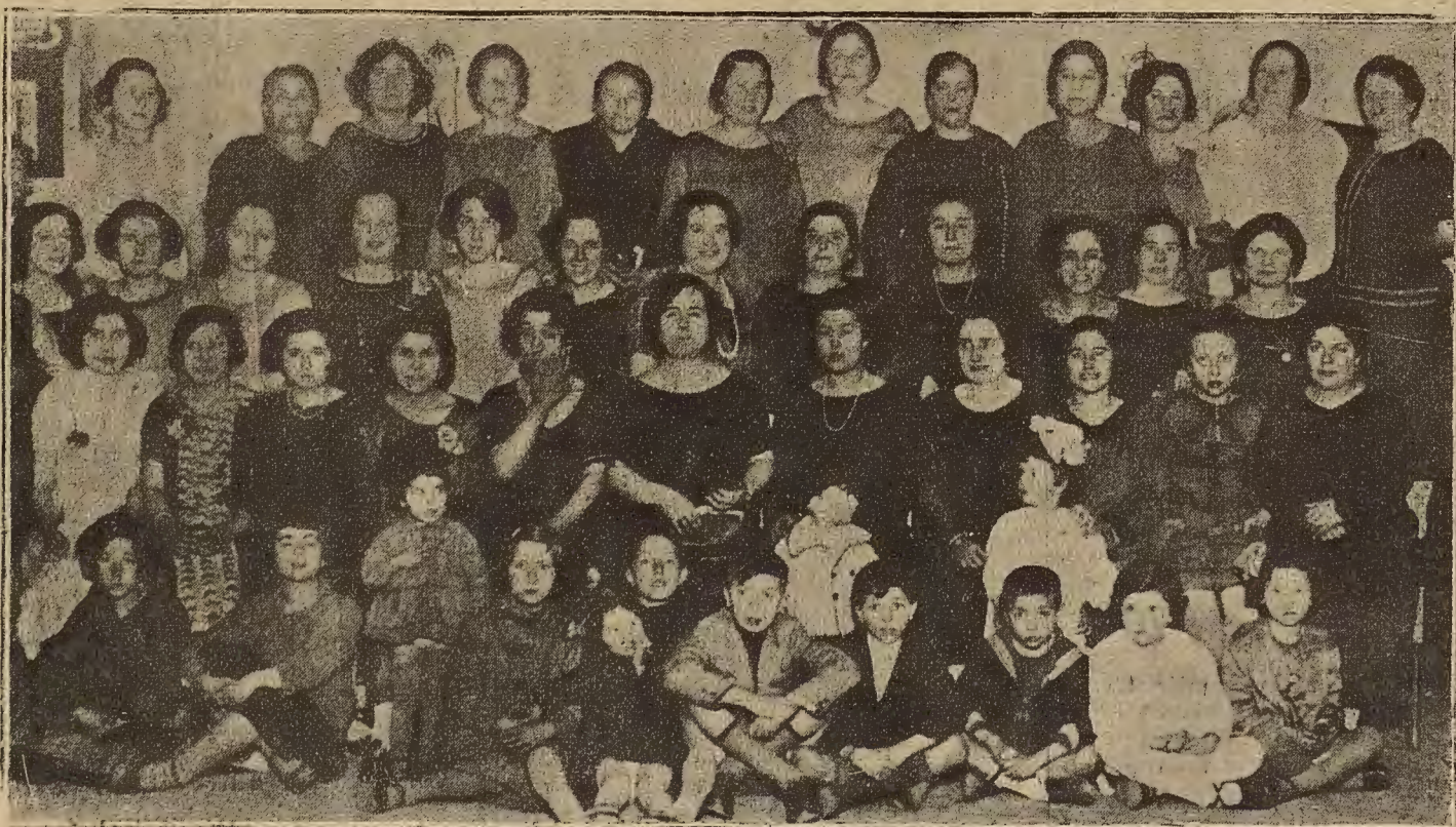
EPILOGO DEL CARNAVAL.—Señoras y señoritas que asistieron al baile celebrado por los carteros en el Casino Conservador.