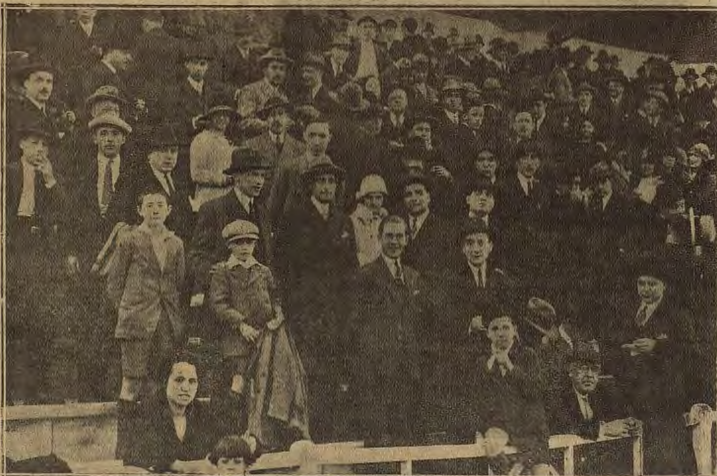
DEL PARTIDO DE FÚTBOL DEL DOMINGO.--Un aspecto de la numerosa concurrencia que presenció el encuentro, Athletic-Iberia.

Los ibéricos, en una reacción, llegaron ante la meta de Eraso, interviniendo la defensa atlética para despejar la difícil situación creada.