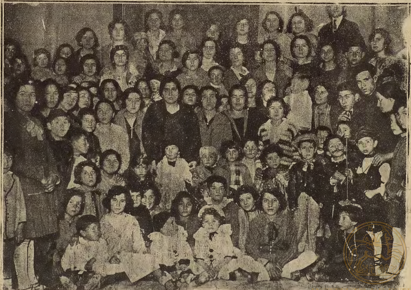
EL CARNAVAL EN ZARAGOZA.—Señoritas que asistieron el domingo de Piñata al baile organizado en el Circo Artístico Musical de las Delicias

Reina gran expectación por oír cantar a esta triple de Torralba de Aragón, que tan