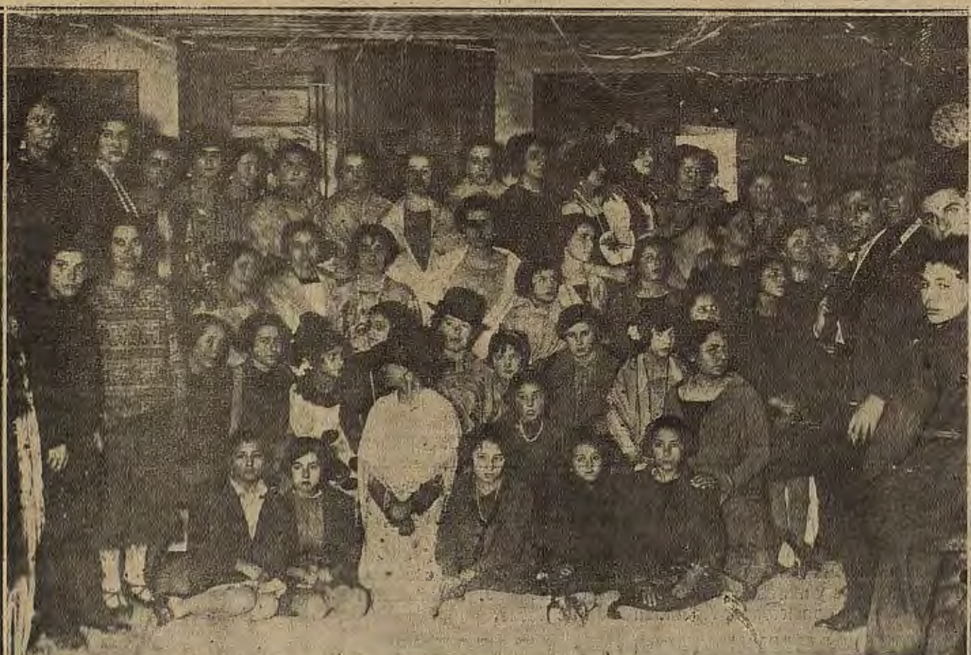
EL CARNAVAL EN EJEJA DE LOS CABALLEROS.—Un aspecto de los bailes celebrados en el Gran Casino.