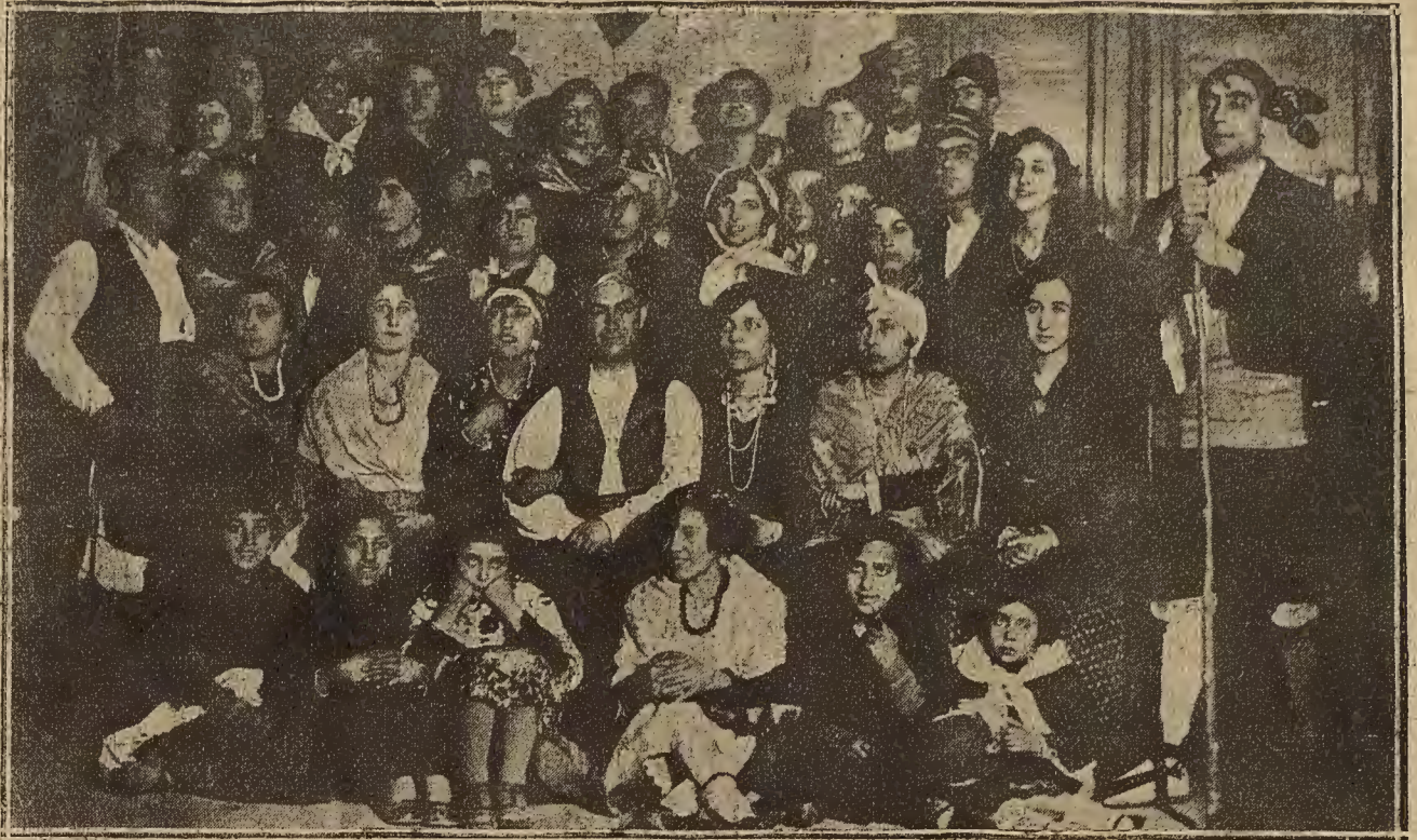
EL CARNAVAL EN LA ALMUNIA DE DOÑA GODINA.—Jóvenes de la localidad que tomaron parte en la fiesta baturra organizada por el Casino Principal

En lugar de sombreros una capota de copa muy pequeña y ala combada y remangada por detrás.