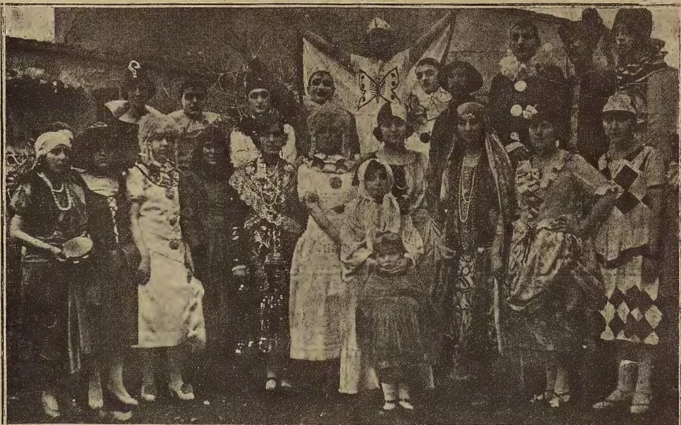
EL CARNAVAL EN LA ALMUNIA DE DOÑA GODINA.—Grupo de máscaras que concurren al baile de trajes que se celebró en el Casino Principal

También en Borja se celebrará una gran Asamblea en el teatro, habiendo prometido su asistencia las comisiones de los pueblos comarcales.