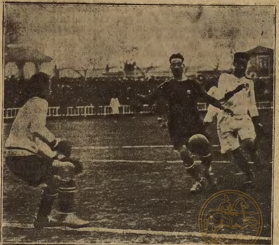
DEL PARTIDO DE FUTBOL DEL DOMINGO.—Un avance del Patria, cortado por un defensa del Huesca.

En el campo del Sans se verificó este match que careció de interés por el cons-