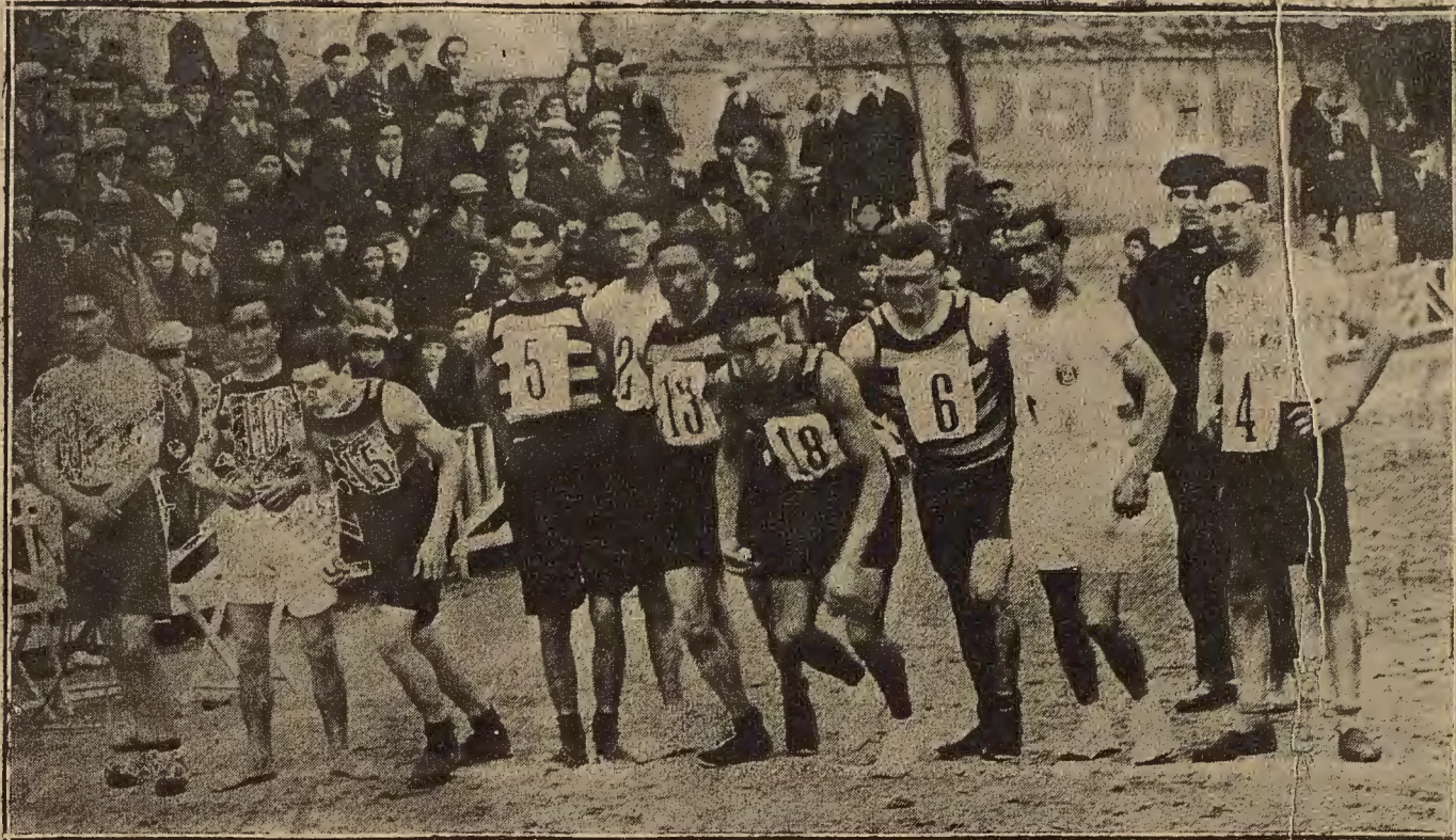
EL CROSS COUNTRY DEL DOMINGO.—Momento de dar la salida a los corredores que se disputaron el segundo campeonato regional.

Una rotunda victoria de los iruneses alcanzaron sobre sus competidores, logrando