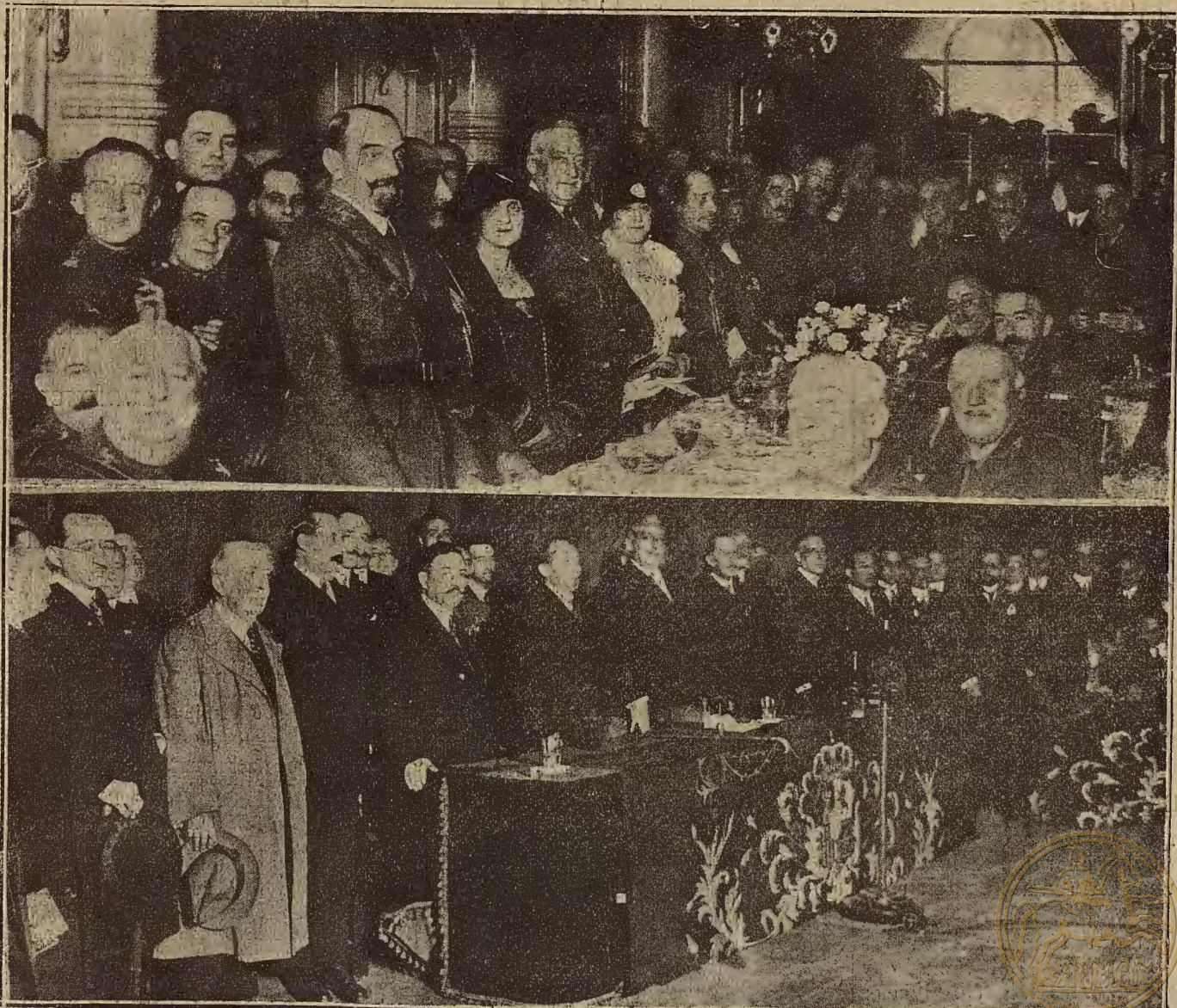
EL JEFE DEL GOBIERNO EN BARCELONA. — Arriba, la marquesa de Poronda, presidiendo el banquete que ofreció a la oficialidad con asistencia del marqués de Estella. Abajo, el general Primo de Rivera, presidiendo el mitin de Unión Patriótica.

Y solicitar del Ayuntamiento la autorización necesaria para estudiar el pliego de condiciones al objeto de abrir nuevo concurso para la construcción de dichas casas.