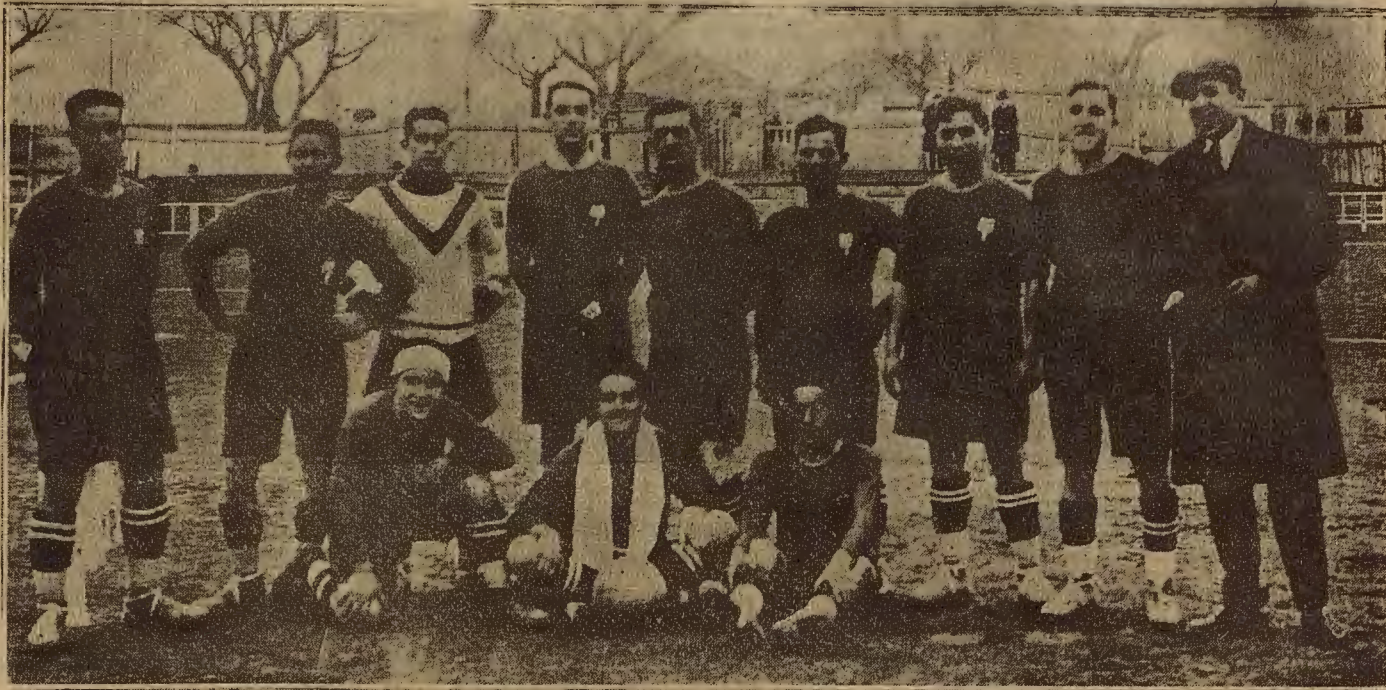
El equipo del Huesca F. C. que venció el domingo al Patria por 4 a 1.

La jornada deportiva del domingo en toda España