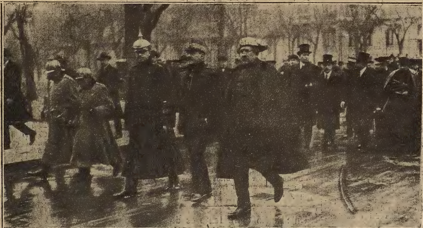
MADRID: EL ENTIERRO DEL GENERAL MARINA.—La presidencia del duelo, formada por el infante D. Fernando, que ostentó la representación del Rey, el vicepresidente del Gobierno Sr. Martínez Anido y los generales Weyler y Burguete.

CAFE GRANJA AMERICANA BAR ESMERADO SERVICIO BEBIDAS Helados, Bacalillos, Licorosos, Uvasolados, Popoveritas, Maticos