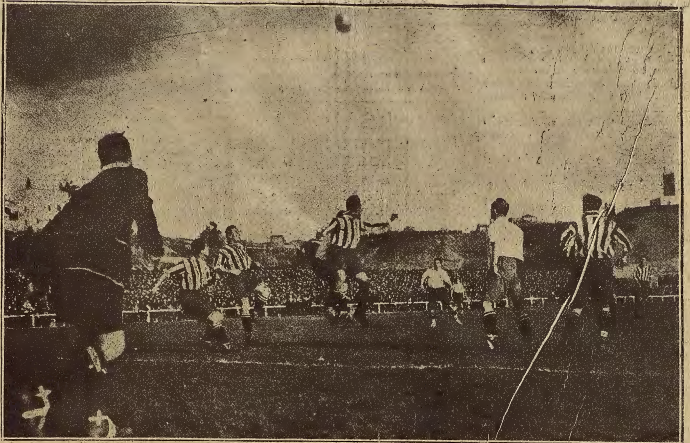
EL FUTBOL EN MADRID.—UN MOMENTO DEL PARTIDO DE CAMPEONATO DE PRIMERA CATEGORIA, JUGADO ENTRE EL REAL MADRID Y EL ATHLETIC, EN EL QUE GANO EL PRIMERO (Foto Vidal).

Noche, a las diez: «Los gavilanes» y concierto por Vendrell.