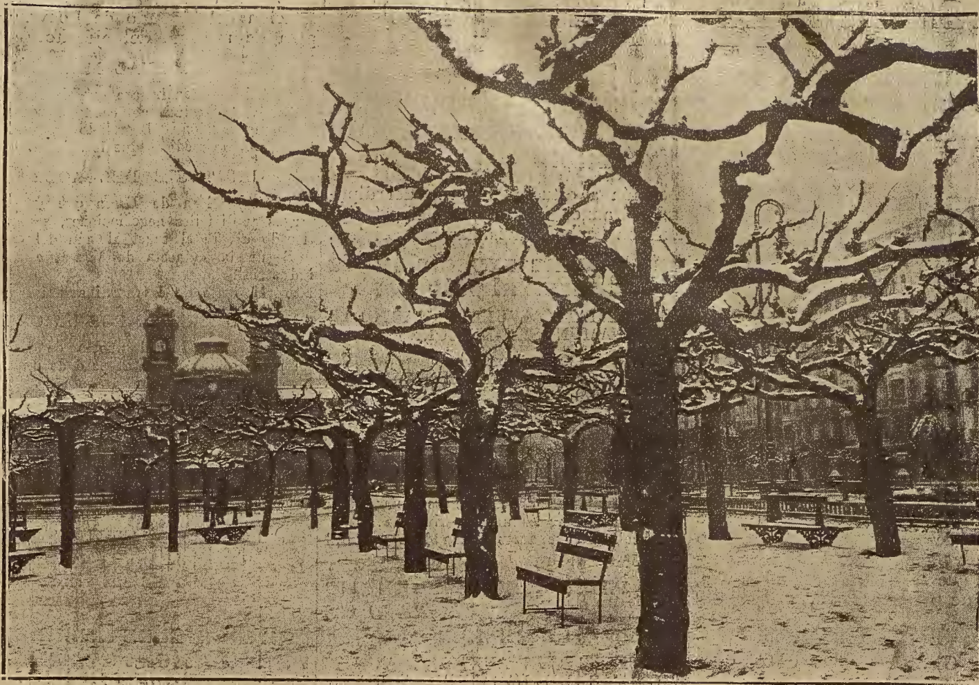
EL TEMPORAL DE NIEVES EN SAN SEBASTIAN.—ASPECTO QUE OFRECIAN EL PASEO Y ALREDEDORES DE LA CONH A DURANTE LA RECIENTE NEVADA

60 metros de altura desde el envase de cimentación, el espesor de su base será de 49 metros lineales, el volumen total de esta obra es de 43.000 metros cúbicos, y su costo, en la actualidad, se puede calcular aproximadamente, en siete y medio millones de pesetas. El importe de la expropiación forzosa de los terrenos que han de inundar las aguas del pantano, ascenderá a un millón y medio de pesetas.