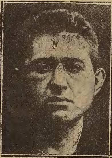
BENITO CASTRO, ANARQUISTA GUI- LLOTINADO EN BURDEOS

En mis escritos anteriores dejé consignado que el río Esera es insuficiente para alimentar el Canal de Aragón y Cataluña, y al sustentar esta tesis es claro y evidente que me refiero al caudal o corriente ordinaria de dicho río, única que en la actualidad se puede utilizar, puesto que la gran masa de agua procedente de las grandes avenidas necesariamente se ha de perder mientras no