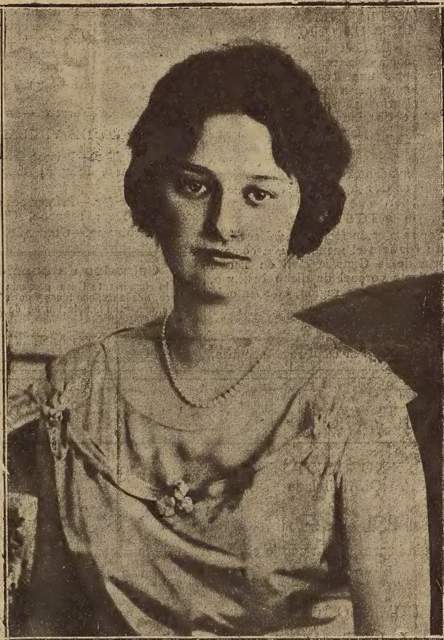
FIGURA DE ACTUALIDAD.—LA PRINCESA ASTRID DE SUECIA, CUYO VIAJE A LONDRES, HA DADO LUGAR A QUE SE HABLE DE SU MATRIMONIO CON EL PRINCIPE DE GALES

Los abajo firmantes, alumnos de las Facultades de Derecho, Medicina, Filosofía y