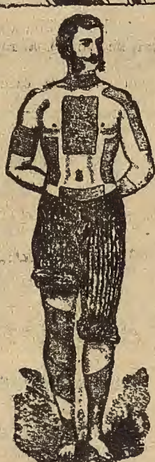
MARCA REGISTRADA EXIGIDA EN LA CUBIERTA DE CADA EEMPLASTO