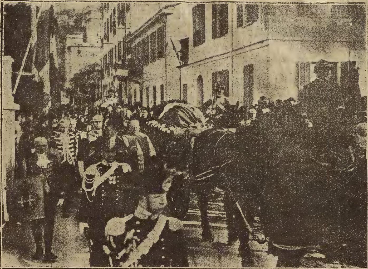
BORDIGHERA (ITALIA).—TRASLADO DE LOS RESTOS DE LA REINA MARGARITA DESDE EL PALACIO REAL A LA ESTACION PARA SER CONDUCIDOS A ROMA